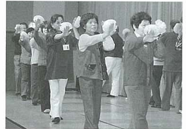
民生委員も踊りを披露