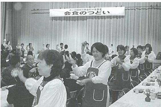
みんなで一緒に「波佐見節」