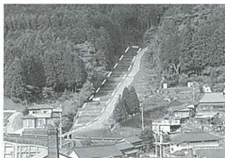
▲世界第2位の中尾上登窯