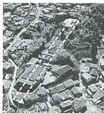
▲世界最大規模の大新登窯 (破線部)