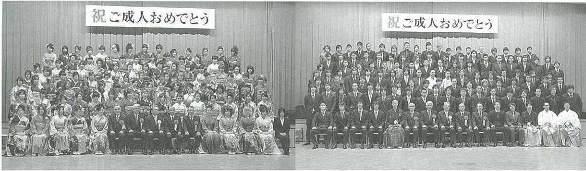
祝ご成人おめでとう