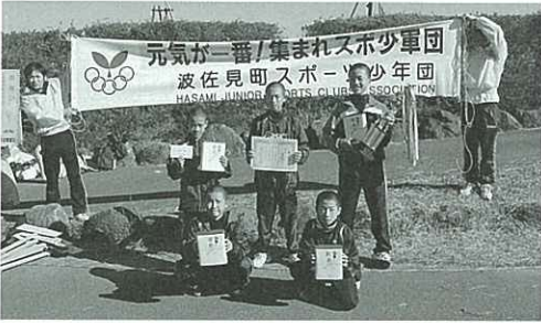
▲優勝した鴻ノ巣少年野球クラブ Aチーム