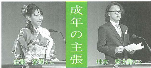
祝ご成人おめでとう