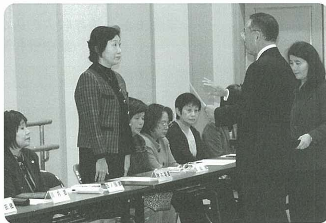
▲厚生労働大臣からの委嘱状が副町長から手渡されました

これにより、各地区より推薦された新任委員を含む31名（うち主任児童委員2名）の委員が今後3年間の任期で活動されますので、心配ごと等がありましたら、お近くの担当民生委員へお気軽にご相談ください。