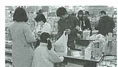
ホームセンターでレジ体験