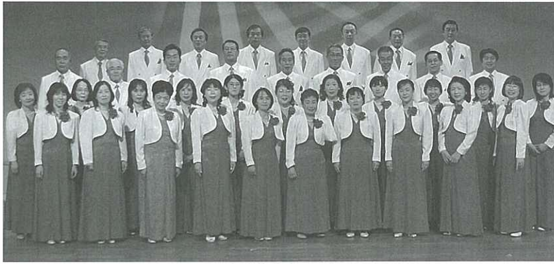
▲混声合唱団メンバー

男声合唱団「アル・コラール」を母体として平成5年9月22日に結成し、今年で18年目を迎える「波佐見混声合唱団」をご紹介します。