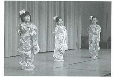
白毫保育園の皆さんのかわいい演技

「いろんな方とおしゃべりできて楽しかった」といった声も聞かれ、盛況のなか終了しました。