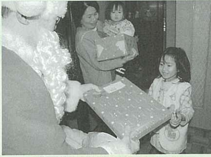
突然の訪問に子ども達も大はしゃぎ

～郷地域福祉活動計画サンタクローズからの贈り物事業～ クリスマス之夜、白い大きな袋を背負ったサンタクローズが中尾郷と皿山郷にやってきました。