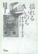
熊本日日新聞「こののりのゆりかご」取材班編 旬報社

鼓笛隊の「おちこぼれ」ピアノ組。練習場所は第二音楽室。あのころ屋上教室には特別な時間が流れていた…。眩しくて切なくてなつかしい、音楽室に彩られた4つのガールズストーリー。『別冊文藝春秋』ほか掲載を単行本化。