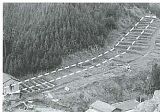
▲世界第3位の永尾本登窯 (昭和50年代撮影)

て日本中で愛用されてきました。江戸時代の多くの人々が波佐見の器で食を楽しんでいた姿を想像すると、何故かわかりませんが、とても嬉しくな