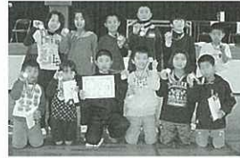
▲優勝した中央小ジュニア陸上クラブB