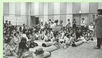
▲プログラムの合間に手遊び