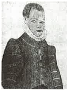
▲原マルチノ 「はさみ100選ガイドブック」より