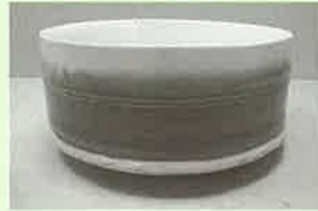
入選 『翠ささやく時』 石添 秀正 (野々川)