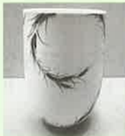
入選 『深鉢ムギ』 長野 恵之輔 (湯無田)