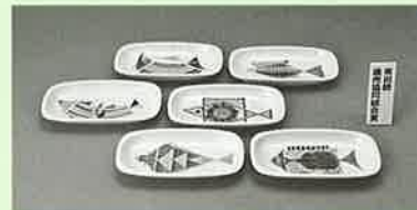
有田焼直売協同組合賞 『これおサカナ?』 長野 恵之輔 (湯無田)