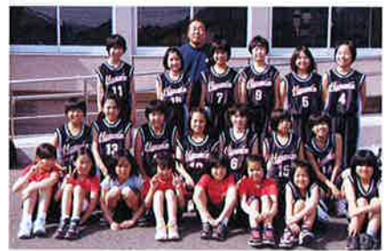
▲入部をお待ちしています!