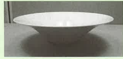
入選 『風花』 山口 春浩 (井石)