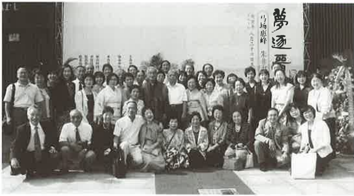
▲昨年8月 中国浙江省紹興美術館にて合同書道展開幕式 溪流会訪中団