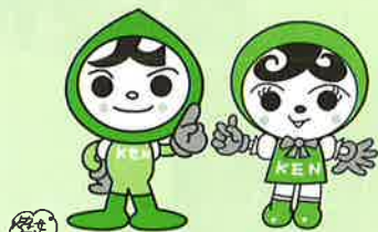
人KENまもる君 人KENあゆみちゃん 人権イメージキャラクター

子どもの人権110番「強化週間」 6月27日（月）～7月3日（日） 8：30～19：00 （ただし、土・日は10：00～17：00）