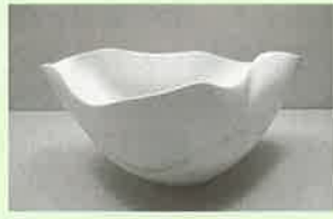
入選 『揺れる心～遥～』 彩雲窯 松尾 修介 (村木)