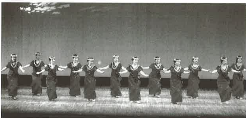
▲平成22年度佐世保市民芸術祭出演時