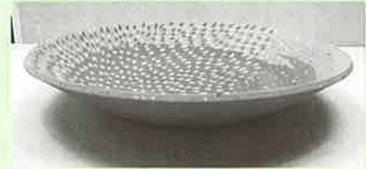
入選 『象嵌大鉢「夜空」』 立井 清人 (稗木場)