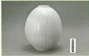
日本経済新聞社賞 『青白磁鎬彫壺』 川添 貞秀 (井石)