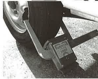
◀タイヤロックの実例