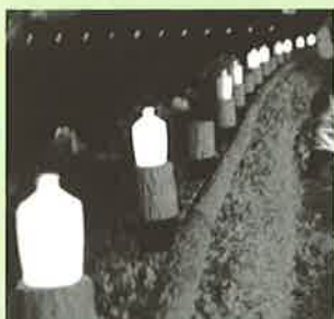
▲コンプラ灯籠による演出