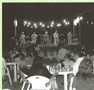
▲波佐見ベンチャーズ（河川公園会場）