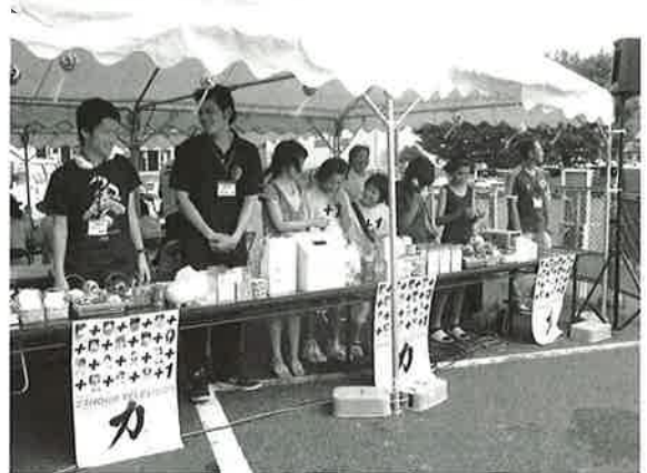
小・中学生、大学生のみんなも頑張って呼びかけました