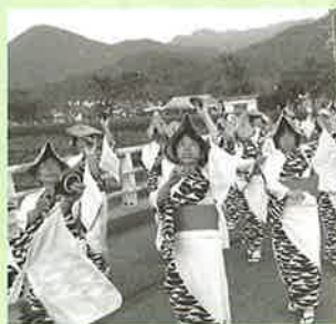
▲婦人会による皿踊り