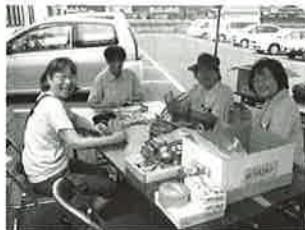
かご作りコーナーも大盛況！