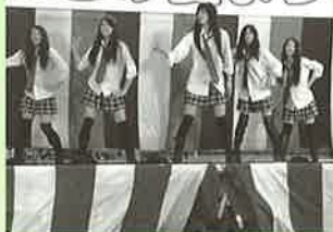
▲長崎キャノン社員による演舞