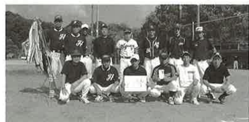
▲優勝した協和長野チーム