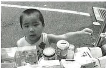
ちびっこもたくさん来てくれました

集まった募金は224,303円になり、福祉・環境・災害援助に使われます。たくさんの方々にご協力いただき、ありがとうございました。