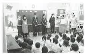
インターンシップ（1年）