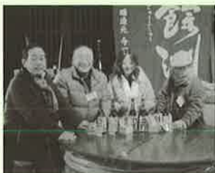
▲完成したMY日本酒と塾生

2月19日、その最後の工程となるラベル作りが行われました。塾生は思い思いの言葉や趣向を凝らした絵をラベルに書き入れ、「MY日本酒」を完成させました。自分で作陶した手作りぐい飲みの披露会が行われた後、絞りたての新酒をぐい飲みに注いで祝杯をあげ、これまで1年間の体験を語り合っていました。