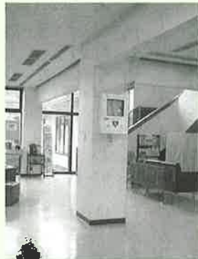
ロビー内に設置した AED