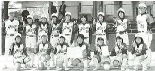
▲九州大会に出場する波中ソフトボール部

昨秋、川棚町で開催された第8回中学生長崎県ソフトボール大会で、波佐見中ソフトボール部が見事準優勝に輝き、3月17日から大分県竹田市で開催される九州大会への出場権を獲得しました。長崎県代表として、活躍が期待されます。