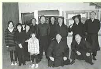
▲皿山人形浄瑠璃出演者のみなさん

本町の皿山人形浄瑠璃『美玉座』は、『生写朝顔話』「大井川の段」を上演し、その熱い演技に対して、多くの喝采をいただきました。