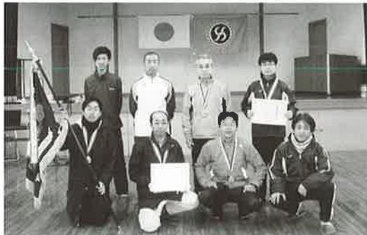
▲優勝した「協和チーム絆」