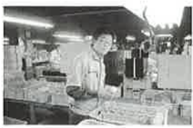
インターンシップ（2年）