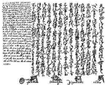
▲ベネチア宛ての感謝状「原マルチノ物語」より