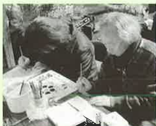
▲ラベル作りに取り組む塾生