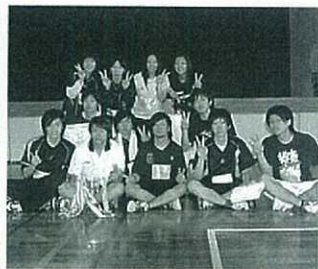
▲混成一部で優勝・準優勝したRAINBOW