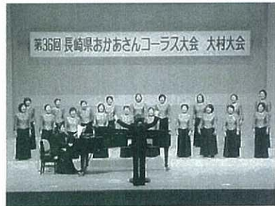
▲昨年開催のおかあさんコーラス大会