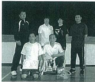
▲混成II部・女性の部で優勝したジュピター