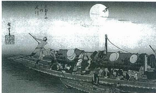
▲浮世絵の三十石船とくらわんか舟 安藤広重

たかを見ていきましよう。ところで、淀川に器をポイ捨てしていたのとありますが、江戸時代の人々はモノを非常に大切にしていたので、これは全く信じられません。後の人の作り話とと思ってください。