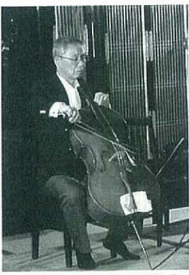
▲お寺でクラシック (教法寺)