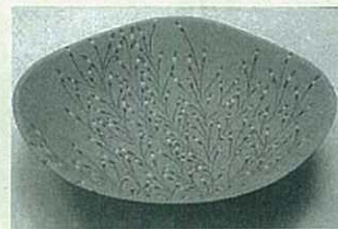
入選 「埋め込み深鉢」