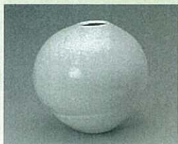
佐賀県陶芸協会賞 「萌動」