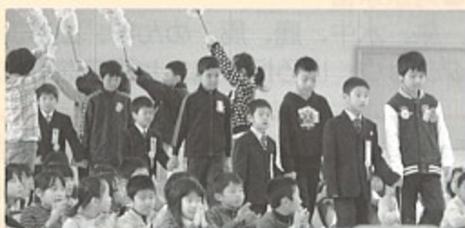
▲6年生に手を引かれて入場する新一年生（東小）