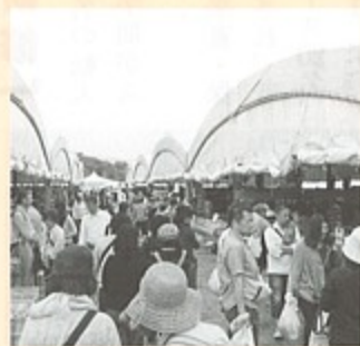
▲初日の午前中から賑わう会場