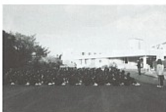
▲宿泊研修「朝の集い」