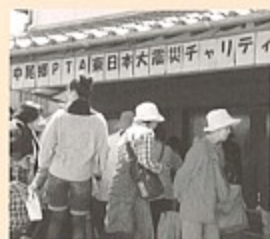
▲チャリティー募金活動の様子

集まった募金178,259円は、長崎県町村会を通して被災地へ義援金として送られます。