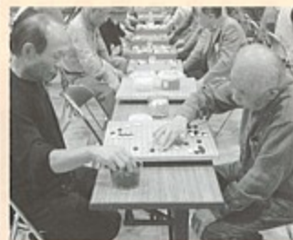
▲盤面での真剣勝負「囲碁大会」