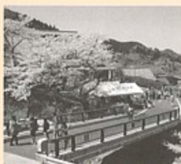
▲満開の桜と散策する来場者