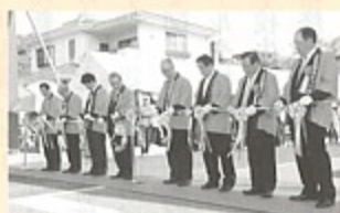
▲オープニングのテープカットの様子

その他協賛イベントとして、期間中「囲碁大会」、「鴻ノ巣カップ春季テニストーナメント」、「弓道大会」も開催されました。