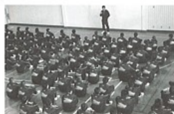
▲宿泊研修「集団訓練」