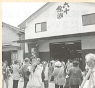
▲新酒の試飲でにぎわう会場

他にも、お楽しみ抽選会やもちまきなどもあり、来場者は満足そうに新酒を土産に帰路につかれています。