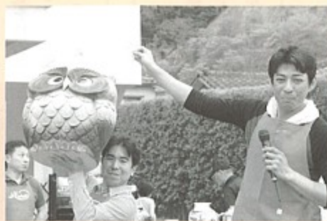
▲威勢のいい声が飛び交った「せり市」