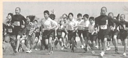
▲一斉にスタートするロードレース参加選手