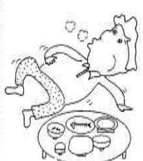
食べすぎに注意しよう

さわやかな秋は体を鍛えるのに最も適したシーズンですが、それと共に食欲の秋でもあり、つい食べ過ぎるシーズンでもあります。夏の暑さで消耗した体力を回復させるのは良いのですが、ゆだんして食べ過ぎないように注意したいものです。 食べすぎ、運動不足による肥満が成人病を誘発しやすくなることは御存知の通りです。そこで自分の体重の増減のチェックは「健康度」をつかむ一つの目安になります。 一日に二〇〇カロリーから三〇〇カロリーは運動することによってエネルギーを消費するよう努力することも大切です。