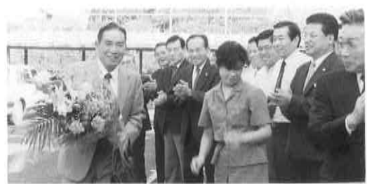
▲9月22日初登庁。職員が庁舎前を出迎えました。

は夢と希望の持てる活力ある町づくりに努力したいと存じます。 以上所信の一端を申し述べましたが、本町が抱えるさまざまな問題を解決するには、一朝一夕に出来るものではないかもしれませんが、町政発展のため最善の努力をいたす所存でありますので、何卒町民皆様方の一層のご指導とご鞭撻をお願い申し上げます。就任のあいさつといたします。