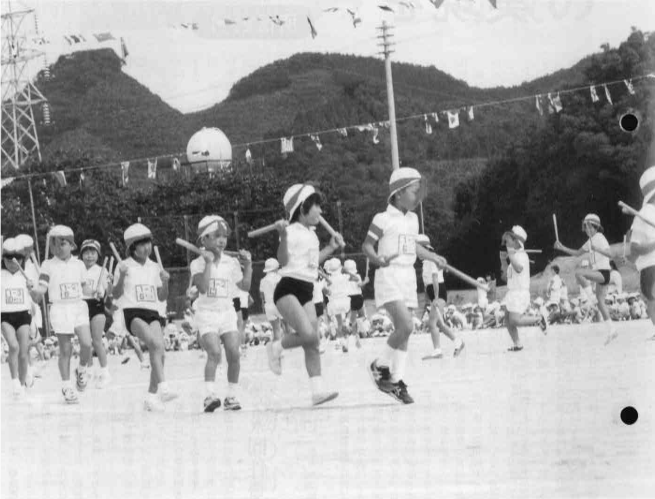
中央小運動会＝甲辰園グラウンド