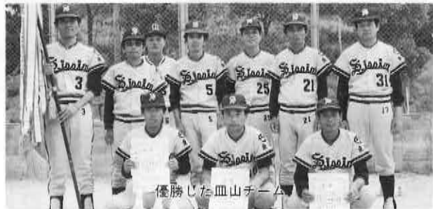
優勝した血山チーム

▶八月二十九日(鴻ノ巣公園) 町壮年スポーツ会・軟式野 球・ソフトボール協会合同 大会