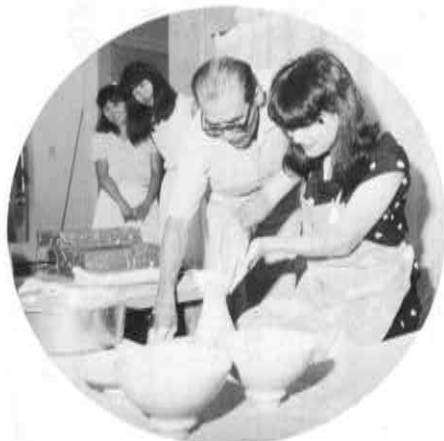
▲8月29日、東京の週刊誌社企画(全国募集)による旅行団約50人が陶芸の館を訪れ、楽画、ロクロ実演などを学び楽しいひとときを過ごしました。