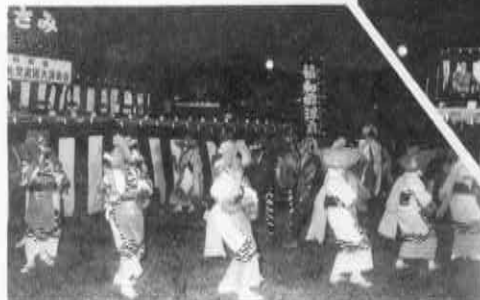
伝統を守ります「協和浮立」

きて八月十二日から本県を訪れていたもので、この日は、午前中から町役場などで町関係者をはじめ町身障者代表や児童合唱団などと交流を深めるとともに、さらに友好の輪を広げました。