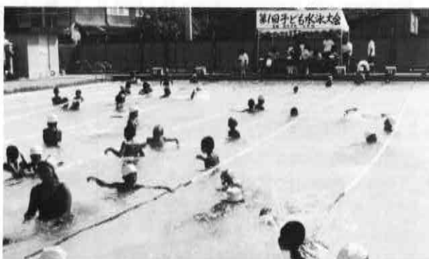
▲「第1回子ども水泳大会」が8月24日中央小プールで開かれ、町内3小学校の児童約100人は、25メートル自由形・平泳ぎや遠泳競技などで腕を競い合ったのをはじめ、ゲームなどで親ほくと交流を深めました。