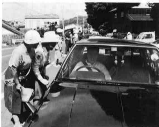
▲シートベルトを着用しましょう!! 9月からシートベルトの着用が義務づけられましたが、これに先立ち8月24日、町交通安全母の会などが街頭で着用への呼びかけを行いました。当日はまた約2時間にわたり着用率を調べた結果約42%と8月1日からの着用運動の効果があつたようです。