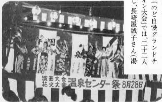
婦人会隔りで花を添える