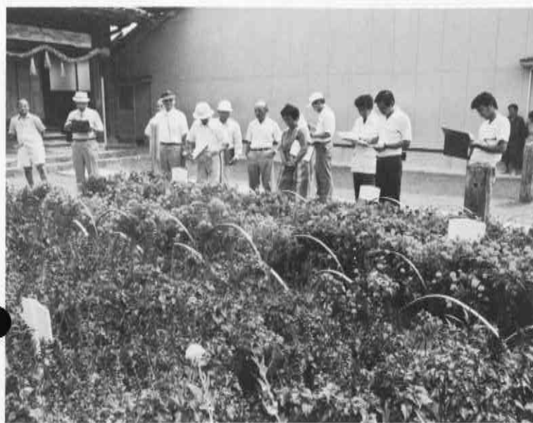
設置の状況、生育の状況、管理の状況など入念にチェックする審査員

長四十五人）が昨年に引き続き選ばれました。十回目を迎えた同コンクール。今回は、町内の老人ク