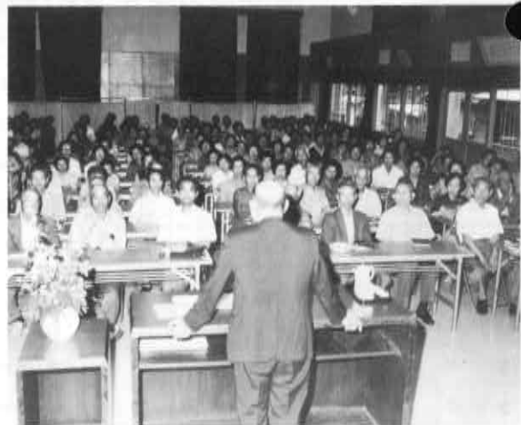
毎月開かれている「高齢者大学講座」には多勢が参加し、健康問題や福祉問題、さらに生きがいなどについて積極的に学んでいます。