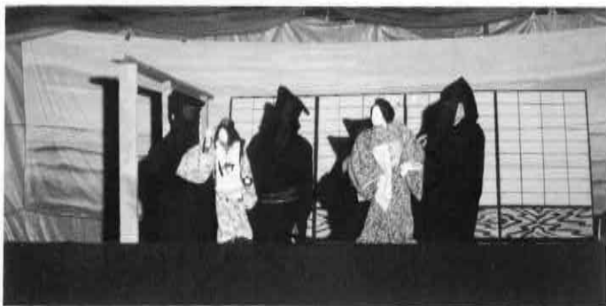
▲8月21日皿山大神宮夏越し祭奉納演芸会で伝統ある「皿山人形浄瑠璃」(美玉座)が披露されました。写真は「傾城阿波の鳴門・巡礼歌の段」のひとつコマです。