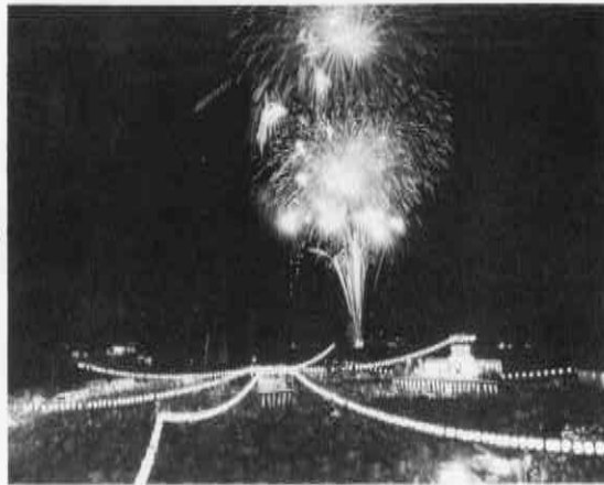
8月14日のはさみ夏まつり