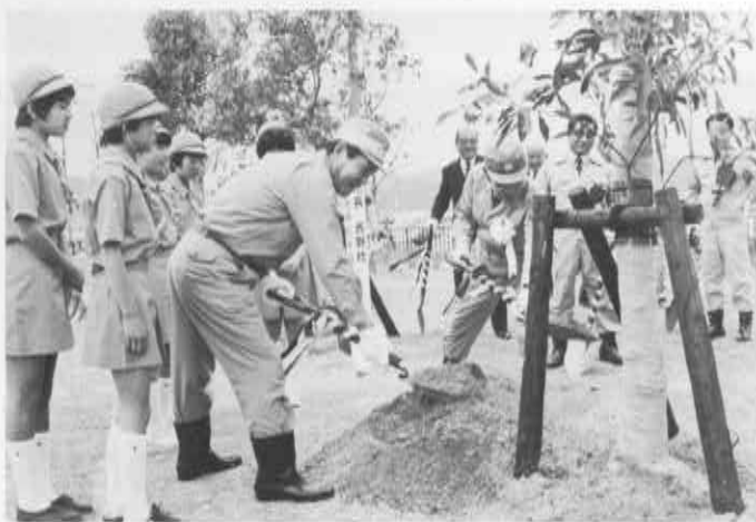
▲昨年、福江市での県民植樹祭 本町「緑の少年団」なども参加しました

明るく住みよい緑豊かな郷土を築くためにみなさまの温かいご理解とご協力をお願いいたします。