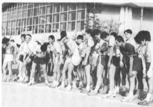
▲緊張の瞬間(スタート前)