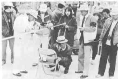
▶審判・記録など大変でした