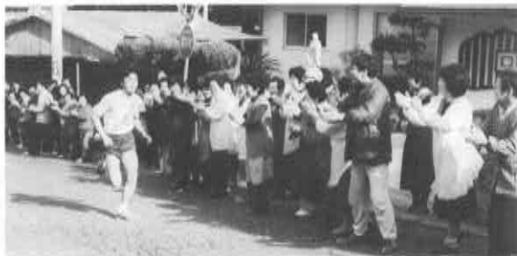
▶応援が選手にとって何よりの力