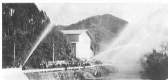
▲湯無田橋付近での放水演習