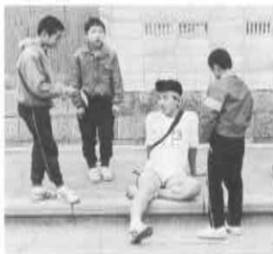
▶兄ちゃん、きつかった?