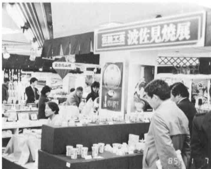
▲人気のあった波佐見焼展

「伝統工芸波佐見焼展」が、去る一月四日から九日まで、東京都新宿区にある京王百貨店で開催されました。これは長崎県と県物産振興協会が毎年開いている「長崎県の物産と観光展」の中で催されたもので波佐見焼が出されたのは二回目。今回は特に伝統的工芸品としての波佐見焼を紹介し、需要開拓とPRを兼ね、物産展の特別企画として設けられました。会場に並べられた百六十点余りの製品は、手づくり手描きのものがほとんどで、訪れた人の中にはすばらしい製品と会場の一角で行われた絵付け等の実演にため息をつく人もあり、高級品の印象を与えていたようです。