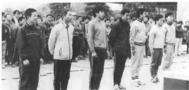
▲区間賞の選手たち—左から1区(2区・4区は代理)