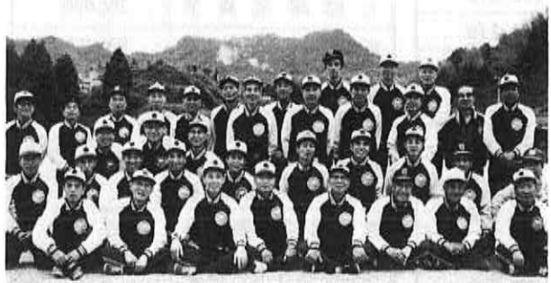
▲中尾郷グラウンドに集合した「大昭クラブ」の皆さん

運営規則も定め、ユニークなのが三カ月で千円の会費。現在五十七人のメンバーは、親睦と融和をモットーに、地域の中心的存在として活動中です。これからも、ボランティア活動などにも手を広げて、地域に密着したクラブづくりを目ざそうと気合いも十分の「大昭クラブ」です。