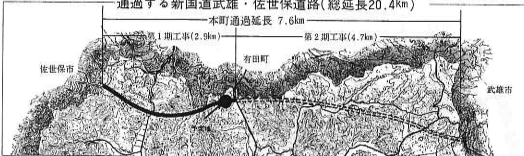
通過する新国道武雄・佐世保道路(総延長20.4km)

第二期工事(岩峠～武雄)区間が、六十三年度に完成することにより、「一般国道三十五号武雄・佐世保道路」二・四*が全て完了することになります。したがって全線開通は、六十四年四月になる予定です。 念願であった、新国道の完成により、本町の交通網が変わるだけでなく、沿線地区はもとより、町全体に新しい活力をもたらすことが期待されます。