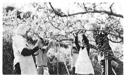
◀野にも山にも若葉がいっぱい 茶つみ(野々川郷)