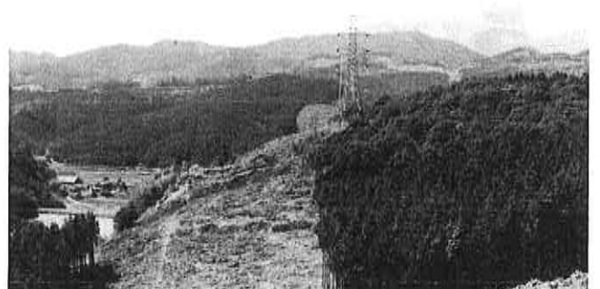
▲村木峠付近から佐世保方面