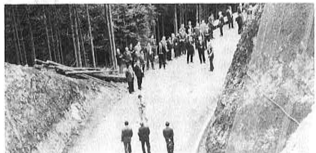
▲3,399 m 地点（川棚町との境）