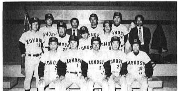
躍が期待されます。 ▶鴻ノ巣クラブの選手

同クラブは、六月二日から鳥取県で開かれる、西日本大会に向け、毎日練習に励んでいます。