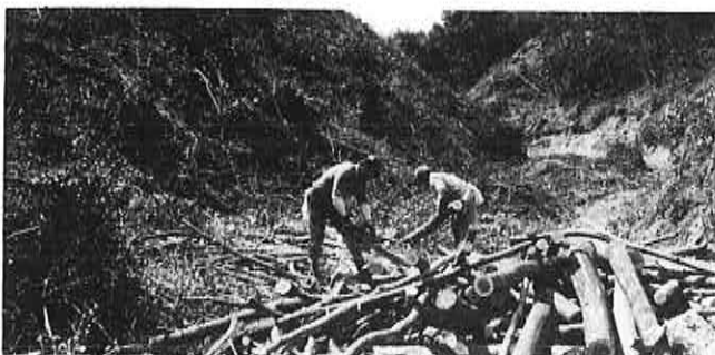
▲伐採後それぞれ区分し運び出される