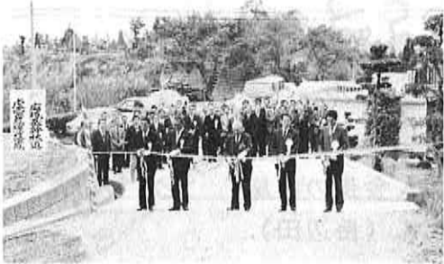
▲テープカット（起点中尾）

本町でも、この広域基幹林道虚空蔵線の関連林道として、永尾線も工事中であり、今後の地域林業の発展が期待されています。