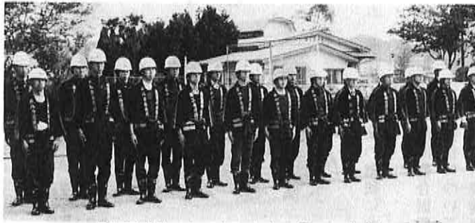
▲「新入団員です。よろしくお願いします」