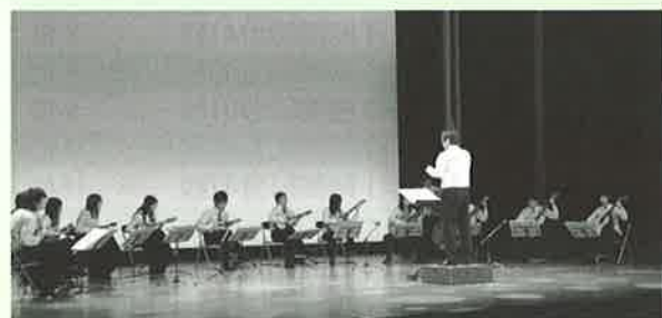
▲長崎県立大学ギターマンドリン部による演奏