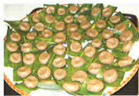
いもだごは「切りもだご」とも呼ばれ、昔はご飯の代用食として食されていたそうです。