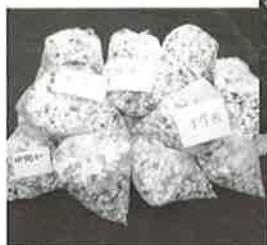
▲回収されたキャップ

なお、この「ペットボトルキャップ回収」については、今後も引き続き行っていくこととなっています。