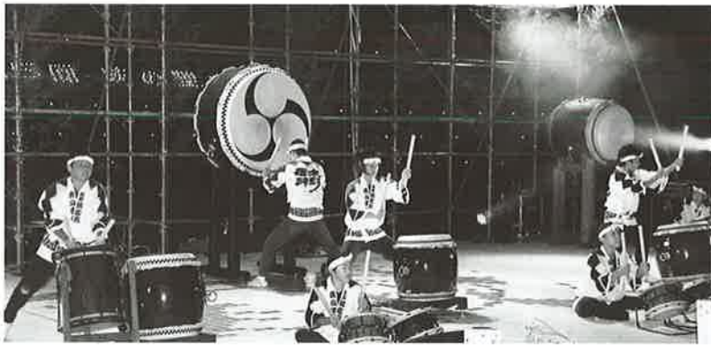
▲映の里豊稔太鼓まつり

小学2年生から高校3年生までの12人で楽しく、時には厳しく和気あいあいと日々練習に励んでいる「鹿山雷神太鼓」をご紹介します。