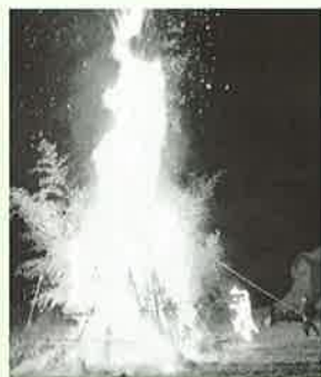
▲稗木場郷の鬼火焚き