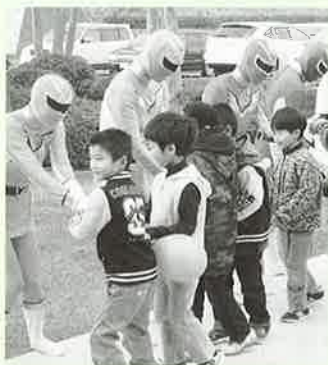
▲はさみ炎レンジャー握手会