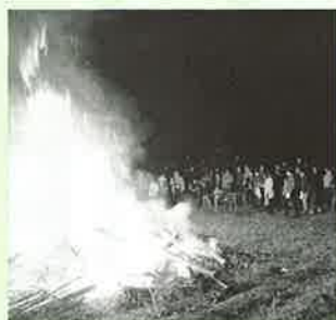
▲岳辺田郷の鬼火焚き

また、岳辺田では初めて夜に開催したり、川内の下組班では約40年ぶりに開催するなど、地区各々で工夫を凝らしての開催となりました。