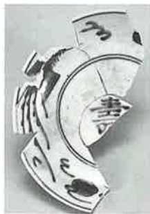
▲類似品がベトナムで出土

辺後ノ谷窯から出土したやきものは、ベトナム向けなどの輸出品と国内向けの製品とが見られます。非常に洗練された美しいものが多く、優れた陶工の存在をうかがい知ることができます。