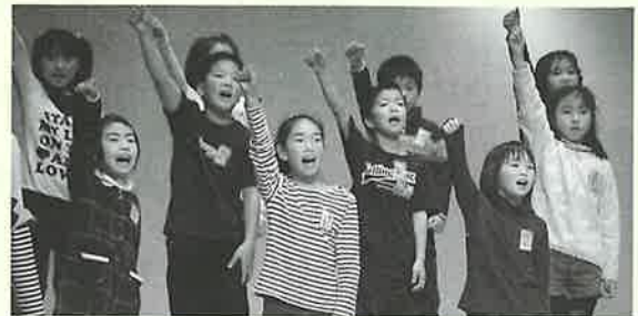
▲違う学年でも心を一にして合唱 東小3・4年生