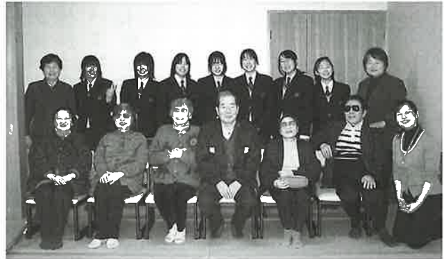
音訳ボランティアに関心がある波佐見高校生の参加を願っています

わかりやすい声で情報を伝え、世代を超えて支え合う音訳ボランティア活動。波佐見高校の皆さんにご協力いただき、本会がこの活動を始めて17年になりました。これからも町の大切な情報が、ボランティアのあたたかい声と共にいつまでも届けられるよう皆様のご理解とご協力をお願いします。