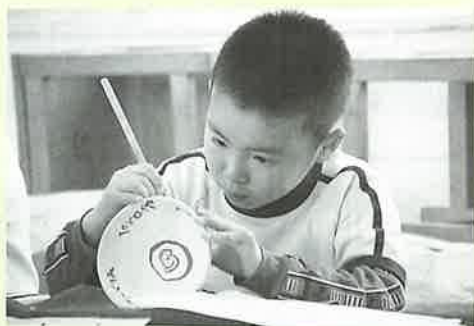
▲真剣な眼差しで絵付けに挑戦

子どもたちは、花や動物、好きな言葉やキャラクターなどの絵を伸び伸びと素焼きの茶碗に描き、「難しかったけど、初めてにしては上手に出来た」と話していました。