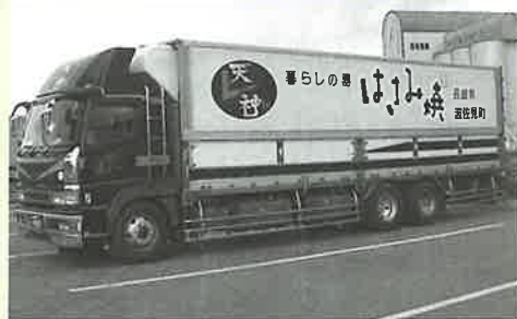
▲波佐見焼の“動く広告塔”として活躍するトラック

この都市部を走る大型広告塔により、「波佐見焼の販売額が増大できる」と大きな期待が寄せられています。