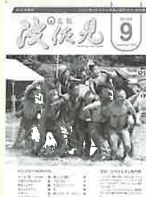
▲優秀賞の9月号表紙