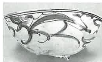
▲辺後ノ谷窯出土品 輸出品

稗木場山最初の窯については、旧派出所の裏山にある辺後ノ谷窯、皿山公民館を奥に入った向平窯、このいずれかと考えられますが、向平窯の発掘調査が実施されていないため結論はまだ出ていません。いつかは向平窯を掘って、はっきりさせたいと考えています。