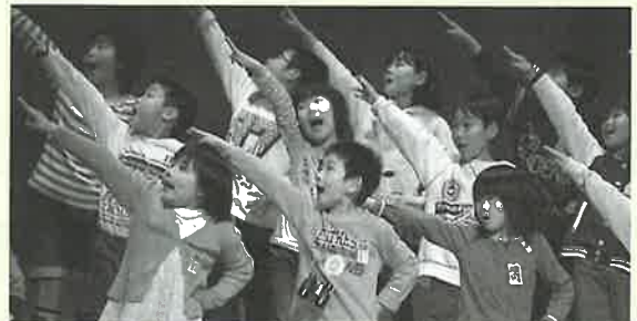
▲歌・踊りを交えて波佐見探検をユニークに発表 中央小2年生