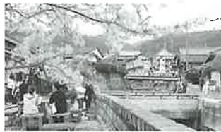
▲毎年多くの人で賑う桜陶祭

先人たちは、この170mもの窯を焚きあげるのに、神仏に祈りながら仕事をしていたのではないのでしょうか。陶山三神社の祭礼は現在においても脈々と受け継がれ、陶芸の里に相応しい景観はこの地を訪ねた人達に心地よい感動を与えてくれます。 また、県の文化財として保存されているレンガ造りの長い煙突が昔のやきものづくりを偲ばせ、今ではこの地の貴重なシンボルとなっています。 毎年たくさんの人で賑う桜陶祭は、平成元年の若焼会の野焼き作品の出版を始まりとします。その取り組みが広く郷民の共感を呼びました。今では、4月の第一土曜日曜日に開催され、この日は各窯元が家を開放して出店し、陶箱弁当のほか、この地ならではの商品を格安で販売しています。 平成4年には里づくり協議会が発足し、ガードレールがレンガの登り窯をイメージしたものになり、更に枝道のレンガ敷なども整備され、郷内の橋名も郷民からの募集により命名しました。 平成8年には新しく交流館が完成し、二階には古陶磁器の展示と郷内各窯元の商品の即売も行うています。交流館の近くには、ロク口による作陶などができる伝習館があり、低価格で宿泊できる施設も整備され、波佐見の顔としての役割を担っています。