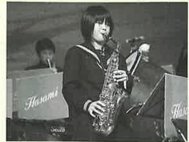
▲心弾む演奏 波佐見中学校吹奏楽部

音楽祭では、波佐見ベンチャーズの軽快な バンド演奏を皮切りに、コール・はさみや波 佐見児童合唱団、波佐見混声合唱団の美しい ハーモニー、 波佐見中学校 吹奏楽部の演 奏、各小学校 の歌や踊りを 交えた楽しい 発表が行われ ました。