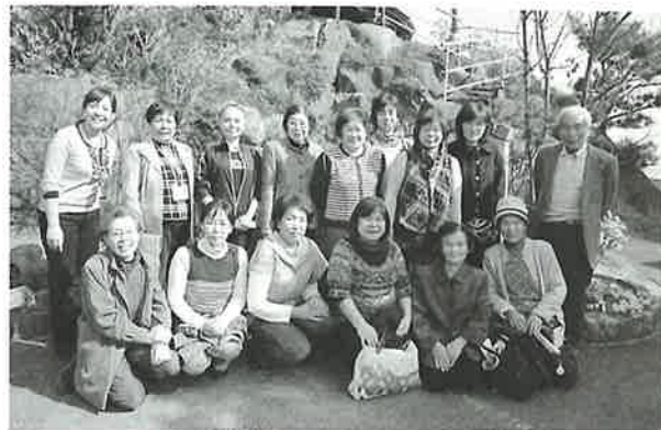
笑顔が素敵な参加者の皆さん

今回は温泉入浴や交流会でわきあいあいと気分転換し、楽しいひとときを過ごしました。