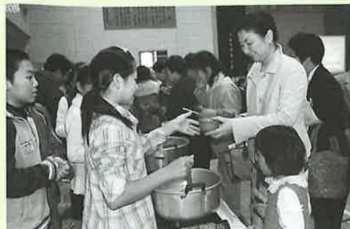
▲手作りの「こだわりみそ汁」は大人気

また、大根・かぼちゃ・ほうれん草、生ごみリサイクル土で自分達が作ったニンジンなどを使った、具もダシもそれぞれ違う5種類の「こだわりみそ汁」試食コーナーもあり、「おいしい。何杯でもいけるね」と食べた全員が心も体も温まっていました。