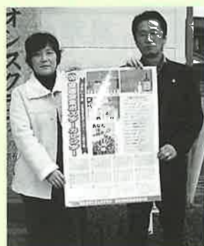
▲製作されたカレンダー

波佐見ライオンズクラブと町交通安全母の会が、2009年交通安全カレンダーを製作されました。