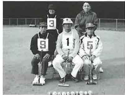
▲優勝した波佐見チーム