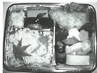
心あたたまるお弁当

「会食のつどい」開催にあたり、オートピア様、割烹堀江様、小鳥居病院様、長生苑様に送迎用バスのご協力をいただきました。ここに厚くお礼申し上げます。