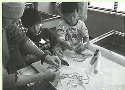
▲包丁を使って麺を切る様子「早く食べたいな〜」