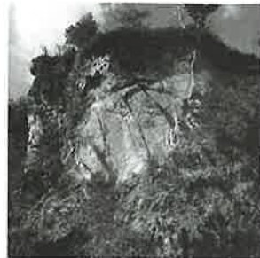
▲三股砥石川陶石採石場(国史跡)

当時の三股は、木が生い茂るばかりの谷で、前人未踏の地であったと思われませんが、陶工達は川を遡り、木を切り開いて集落を作り、そして、窯を築いたものとみられます。