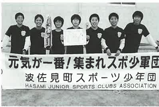
▲優勝したデサフィーゴ波佐見FC Aチーム