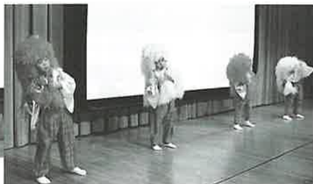
鴻ノ巣保育園園児によるお遊戯