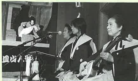
▲7日に上演された『皿山人形浄瑠璃』