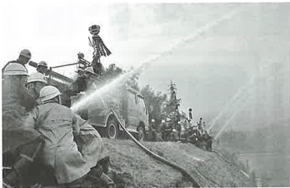
▲ 団員による一斉放水

また、長年にわたって消防活動に尽力された方々や無火災分団の表彰のほか、全分団による勇ましい市中行進や一斉放水が披露されました。