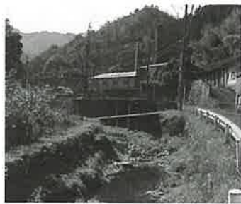
▲この川を遡ったのだらう

当時の三股は、木が生い茂るばかりの谷で、前人未踏の地であったと思われませんが、陶工達は川を遡り、木を切り開いて集落を作り、そして、窯を築いたものとみられます。