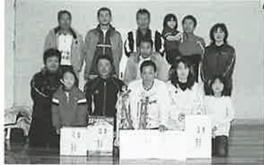
▲男子の部優勝のサターンチームと混合の部準優勝のジュピターチーム