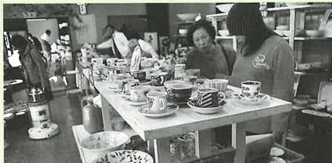
▲心温まるもてなしを受けた後、熱心に品定め

また、7日には皿山人形浄瑠璃の『寿式三番叟』や『傾城阿波の鳴門 巡礼歌の段』も上演されました。