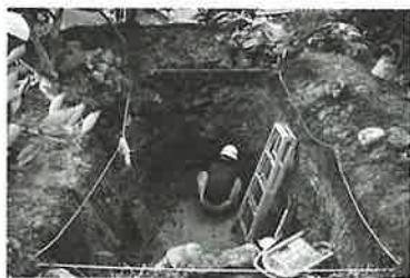
▲三股古窯の調査風景

しかし、次の日の豪雨で発掘区が崩れて土砂に埋もれ振り出しに戻りました。惨状を見てかすかに気が遠くなったのも、今となってはいい思い出です。