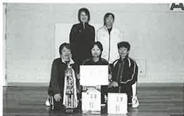
▲女子の部優勝の小樽チーム