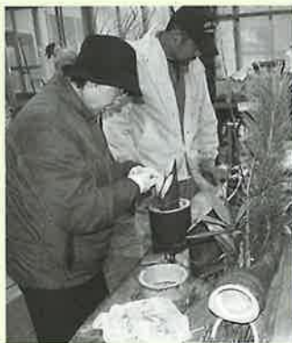
▲大人もミニ門松づくりに熱中

参加者は、シルバー人材センターの方々から熟練された技の指導を受けながら、松や竹、榊を使って自分好みにアレンジした完成度の高いミニ門松を作り上げました。