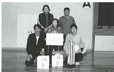
▲混合の部優勝のフォースターズチーム