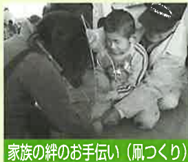
家族の絆のお手伝い(凧づくり)