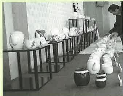
▲洗練された、上品で品格ある器『エレガンス』

『エレガンス』はポットとカップ、『イケメン丼』は丼の形状が形・大きさともにそれぞれ統一されますが、『エレガンス』の絵柄は約30の窯元、『イケメン丼』の絵柄は若手窯元18人の情熱が注がれたオリジナルです。今後、アイデアと技術で勝負する『波佐見焼ブランド』の活性化が大きく期待されています。