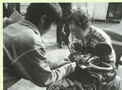
▲反射材をシニアカーへ付ける様子

参加した高校生や中学生が、緊張しながらも「交通安全を心がけ、長生きしてください」などと交通安全を呼びかけると、高齢者の方も高校生や中学生の訪問を大変喜んでいらっしゃいました。