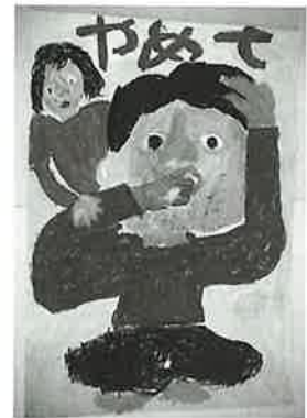
▲優秀賞受賞ポスター