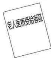
老人医療受給者証