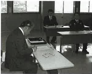
▲川棚署で協定書に署名する一瀬町長