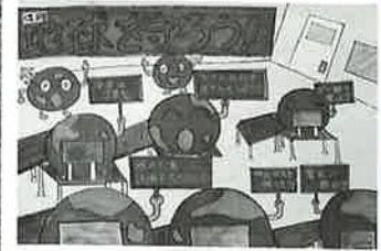
▲特選受賞ポスター「地球を守ろう」