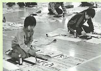
▲一筆に集中する子どもたち