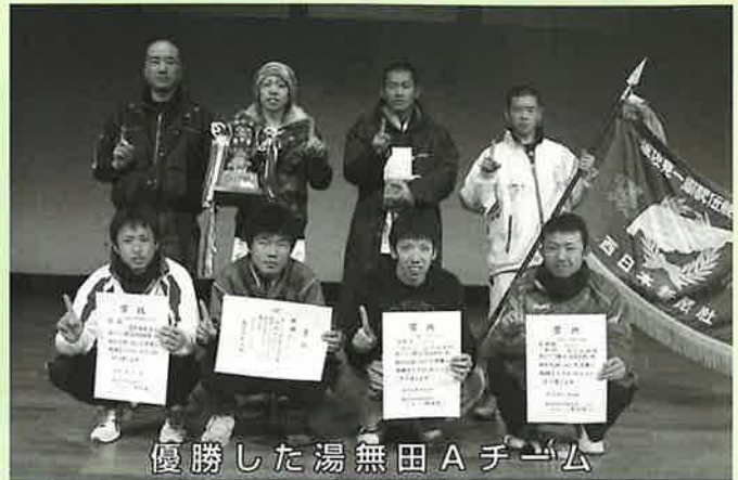
優勝した湯無田Aチーム

第52回波佐見一周駅伝大会が、波佐見中学校をスタート・ゴールとする7区間、30・2kmのコースで開催され、各地区から総勢41チームの287名が出場しました。 冷たい雨が降り、選手にとってコンディション調整が難しいレースでしたが、沿道の家族や地域の方々から声援を受け、思いを込めた一本のタスキをつなぎ健脚を競いました。 レースは、前半(1〜4区)5位とやや遅れたものの、後半(5〜7区)、位と巻き返した湯無田Aが、連覇を狙った村木Aを振り切り、2年ぶり3度目の優勝に輝きました。 躍進賞は、前年の30位から今回9位と順位を上げた金屋Aが獲得しました。