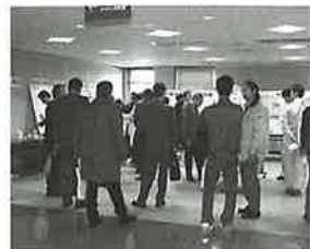
●特許技術発表会 展示会場風景