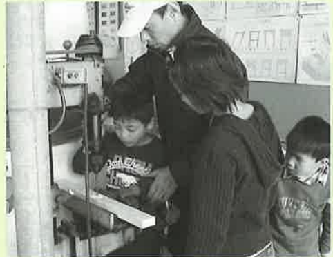
▲ドキドキ緊張 ドリルに挑戦

完成したテーブルは、中には折りたためないものも出来ていたようでしたが、思い出に残る楽しい一時を過ごしていました。