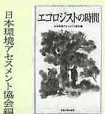
日本環境アセスメント協会編

栄養学の専門家が実母の介護生活で編み出した、おいしい介護食メニュー43を紹介。からだの調子が悪く食欲が落ちたとき、床ずれや、感染症になりかけたときなど、さまざまな場面でのアドバイスも掲載。