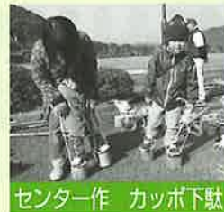
センター作 カッポ下駄