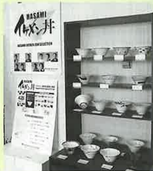
▲麺もご飯もOK『イケメン丼』