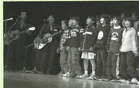
▲『早寝・早起き・しっかり朝ごはん』の歌の合唱

1月13日、第7回生涯学習のつどいが総合文化会館で開催され、約500人が会場に詰め掛けました。