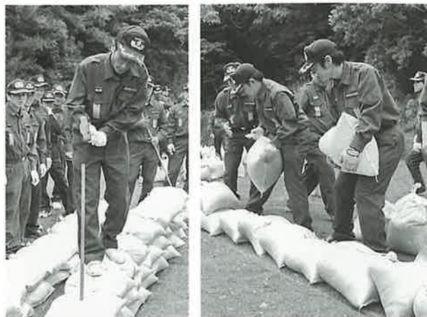
▲川の氾濫や洪水時を想定した、土のう積み訓練▲