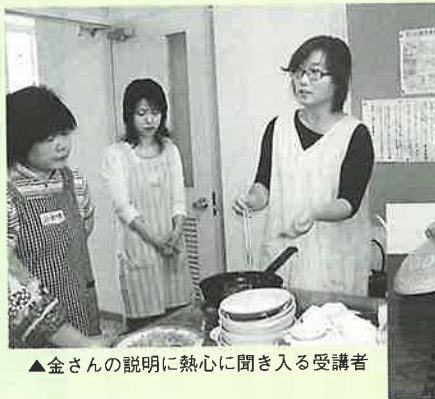
▲金さんの説明に熱心に聞き入る受講者

4月の講座ではキムチとチヂミ、5月の講座ではビビンバとわかめスープ作りに挑戦し、参加者は出来上がった料理の味に満足した笑顔を見せていました。6月の最後の講座では、トッポッキとチャプチェ作りに挑戦します。