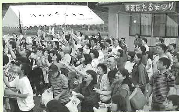
▲もちまきで会場は大賑わい

辺りも暗くなった午後8時頃、幻想的なほたるの輝きが来場者を魅了し、夏の訪れを感じさせました。