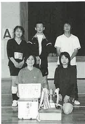
▲混成I部で優勝したウィング