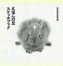
えほんの丘 スケッチブック

体によく、脂っこい＆こってりの料理もさっぱりと食べられるお酢料理。健康効果がたっぷりの酢を使ったレシピを、主菜、副菜、主食&汁物、ドリンク&デザートに分けて紹介。各料理にぴったりの酢もひと目でわかる!