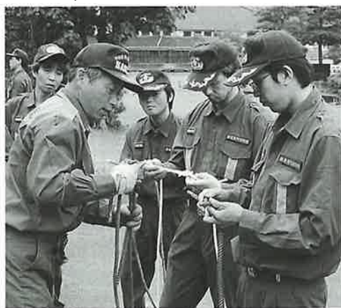
▲消防署の方から、ロープ結びについて学ぶ団員

また、平常時も訓練のほか、機械器具の点検、地域への防火指導、特別警戒などに従事し、消防力・防災力の向上においても重要な役割を担い、中核的存在として町を守っています。