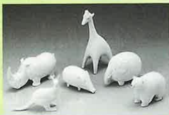
日刊工業新聞社賞 「OKIMONO（動物A）」 山下 行男（宿郷）