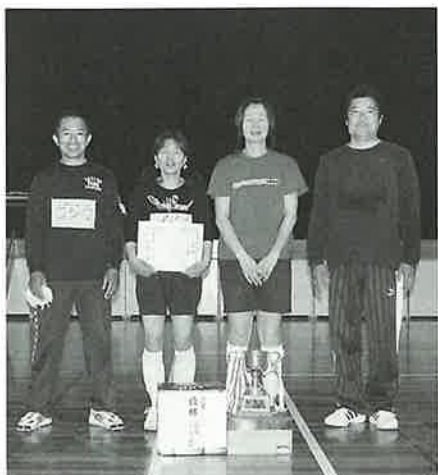
▲混成II部・女性の部で優勝したゴジラ