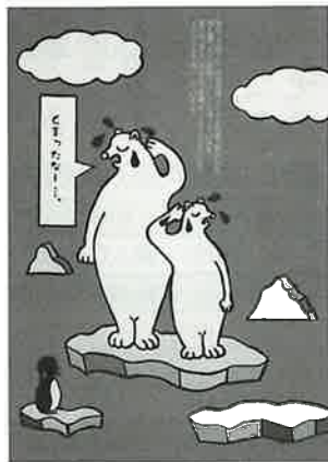
▲佐世保市長賞 「くまったなー…。」井手 羊星