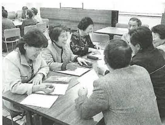
シルバーボランティアと民生委員との意見交換会のようす

午後からは民生委員との意見交換会が行われました。シルバーボランティアと民生委員とが、地域の高齢者のためによりよい連携体制をつくらうと、活発な意見と情報交換ができていたようでした。