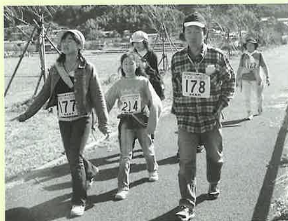
▲桜づつみをウォーキング中（10キロコース）

5キロ・10キロ・15キロ・20キロの4コースに合わせて213人が町内外から参加。それぞれのペースで歩きながら、景色などを楽しんでいました。コースの途中には、お茶やぜんざいがふるまわれ、参加者は「ぜんざいが甘くておいしかった」などと嬉しそうな表情を見せていました。天候に恵まれたこともあり、「来年もぜひ参加したい」という声が多数あがっていました。