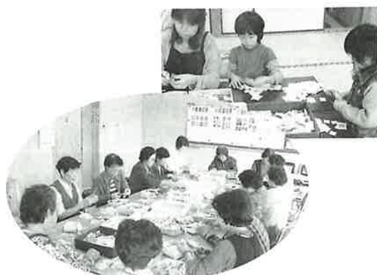
切手仕分けボランティアの様子