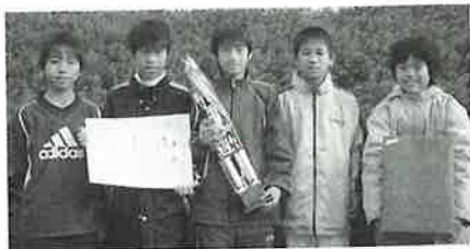
▲優勝した南少年サッカークラブA

大会には、町内の野球、サッカー、剣道、陸上等のクラブから26チームが出場。家族やチームメイトの応援の中、懸命の力走を見せました。