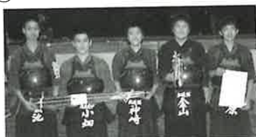
▲中学生男子の部（波佐見弘道館A）