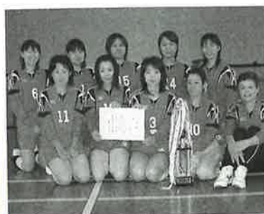
▲優勝したアドバンス