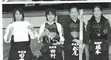
▲中学生女子の部（波佐見弘道館）