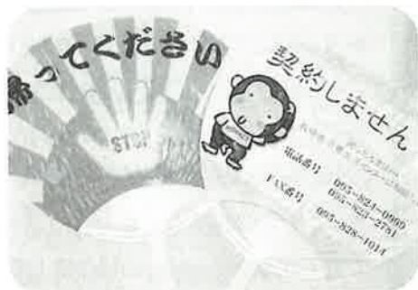
好評だった「契約しません」うちわと「帰ってください」うちわ