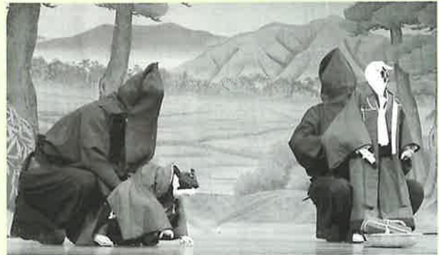
▲熟練された技を披露