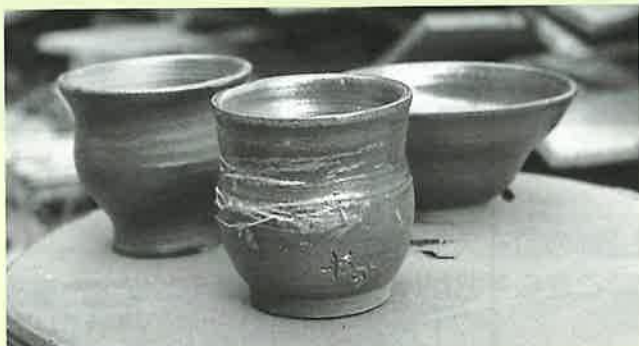
▲できあがった作品

10月14日から23日までと、11月15日から24日までの2回、中尾山伝習館にて、団塊世代を対象とした「大人の長旅やきもの三昧の旅」が行われました。これは、9泊10日の日程で、ろくろ、絵付けから窯焚きまで、やきもの作りにどっぷりとつかっていただくものです。今回は埼玉、大阪、千葉、神奈川などから5名の参加がありました。皆さん熱心に取り組み、それぞれ個性的な作品ができあがっていました。どなたも、「また絶対に来たい」との声や、「退職したら波佐見に住みたい」などの言葉を交わし、帰途につかれました。