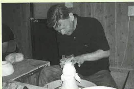
▲やきもの作りを体験