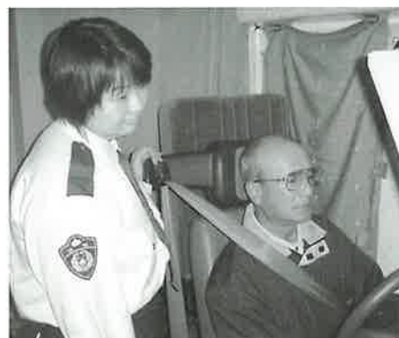
▲交通安全教室の様子