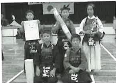
▲小学生低学年の部（波佐見礼心館）

佐見礼心館が、中学生男子の部、中学生女子の部で波佐見弘道館がそれぞれ3位に入る活躍をみせました。