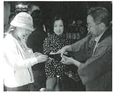
▲酒蔵にて試飲を楽しむ参加者

田植え終了後、地元村木郷の方々に準備していただいたぶた汁とおにぎりでの昼食。地元の方々の心温まるおもてなしに、参加者たちは嬉しそうに笑顔をみせていました。昼食が済むと、今里酒造の酒蔵見学へ。酒蔵では店員さんのていねいでわかりやすい案内に、普段おいしく飲んでいるお酒ができるまでの多くの工程と作業の大変さを実感していました。また、酒蔵ではお酒の試飲もあり、おいしく、香り高い波佐見の地酒「六十餘洲」を堪能しました。