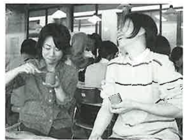
▲自分が作った酒器に思わず「にっこり」