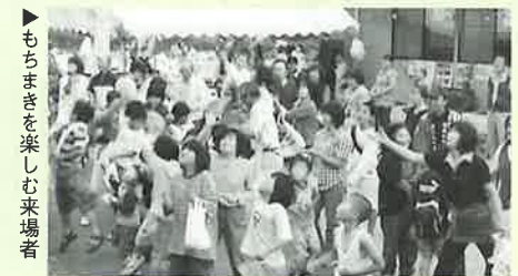
▶もちまきを楽しむ来場者

大にぎわいの会場では、もちまきやゲームのほか、農産物や手作り品の販売も行われ、来場者にも大好評でした。