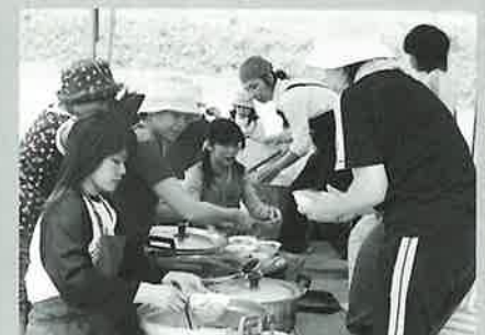
▲③村木郷の方々にお世話をいただいた昼食