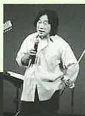
▲ユーモアたっぷりのトークで会場は笑いの渦に