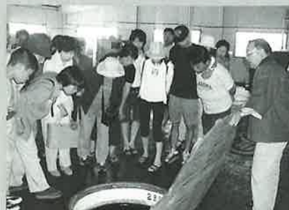
▲④今里酒造酒蔵見学