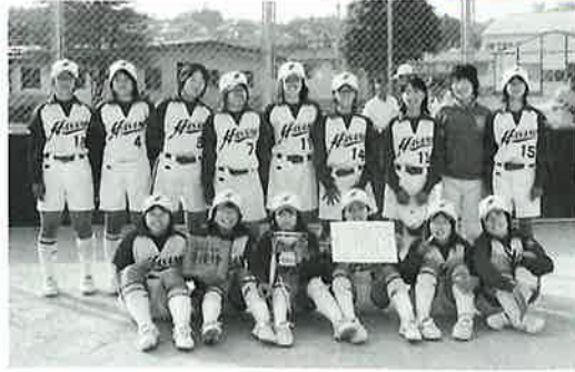
▲準優勝に輝いた波佐見中ソフトボール部