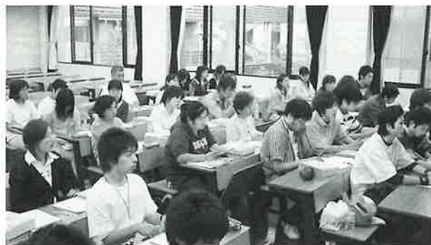
熱心に講義を受けている受講生のみなさん

受講生のみなさん、仕事や家庭等との両立は大変だと思いますが、資格取得を目指しがんばってください！