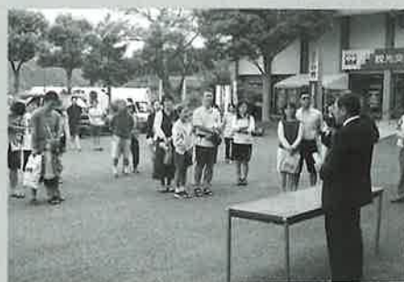
▲①陶芸の館前での開会式