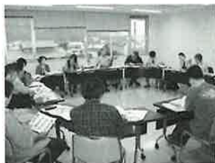
▲5月26日に行われた、第1回の会議の様子

また、今後それぞれの体験を組み合わせ、さらに魅力あふれる体験型観光を作っていくという確認も行われました。