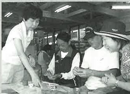
▲⑤手びねりでの酒器づくり体験