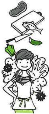
さまざまな食中毒菌

このように毎日の生活のなかで、食中毒を防ぐ三つの原則を守り、食品や台所、調理器具などを常に清潔にするよう、習慣づけましょう。