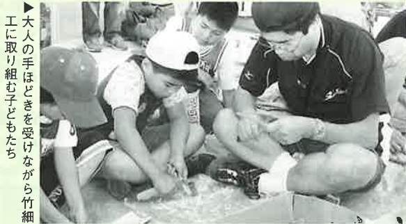
▶大人の手ほどきを受けながら竹細工に取り組む子どもたち

5月29日、波佐見ライオンズクラブ主催の第21回青空天国子供の集いが中央小学校で開催され、普段なかなか体験することができないことに触れてみようとする多くの家族連れが集まりました。