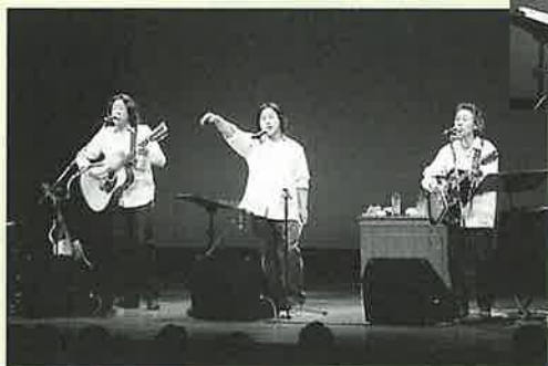
▲数々の名曲を披露する海援隊

ライブでは、「贈る言葉」や「母に捧げるバラード」など懐かしい数々の名曲が披露されたほか、曲の合間のユーモアたっぷりのトークで、会場内は感動と笑いの渦に包まれていました。