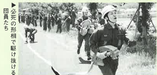
▶必死の形相で駆け抜ける団員たち