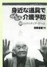
身近な道具で らくらく介護予防

殺伐とした少年犯罪の続発、効率優先が引き起こす重大事故、マニュアル化した仕事…。急激なIT革命がこの国から奪ってゆくものを徹底検証。あいまいゆえに豊潤だった文化の蘇生を訴える、警世の現代日本論。