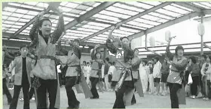
▲桜祭を盛り上げたよさこい隊の踊り