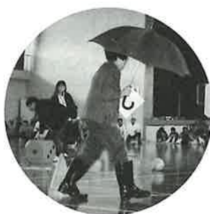
長靴をはいて傘を持って力走! 「運命競争」