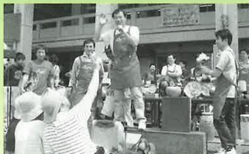
▲たくさんの掘り出し物が出品された商業組合青年部の「せり市」

商業組合青年部のせり市では、安価の掘り出し物のやきものが多数出品され、売り手と買い手の威勢のいい声が響いていました。そのほかにも、工業組合青年部によるお持ち帰りの器付きカレーの販売や名物よかもん市（陶器や特産品のせり市）も行われるなど、たくさんの催し物や出店があり、陶器まつりを盛り上げました。