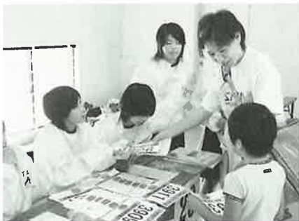
▲波佐見中ソフトボール部も大会に一役