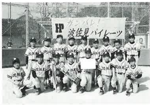
▲優勝した波佐見パイレーツ

決勝は、波佐見パイレーツと鴻ノ巣少年野球クラブの対戦となり、攻守に勝った波佐見パイレーツが5対1で勝利し、優勝に輝きました。