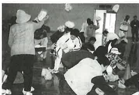
日頃のストレス発散!? 「あっちゃれこっちゃれ」

この運動会では競技の着順がそのまま点数になるのではなく、1位になったチームから順にくじ引きをして点数を稼いでいくというルールがあります。優勝を狙うには、高い点数を引く運も必要。競技で最下位になっても最高点の10点をひいたチームもあれば、1番になったにもかかわらず、1点しかもらえなかったチームもあり、会場には笑いが耐えませんでした。