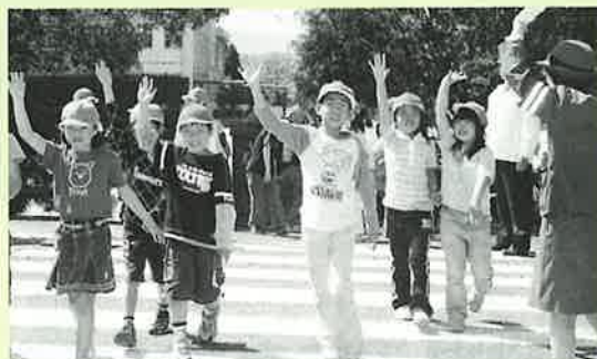
▲大きな声で左右の確認をし、横断歩道を渡る児童たち

児童の代表は「今日学んだことを生かして安全な自転車の運転と歩行を心掛けます」と、お礼の言葉を述べ交通安全を誓っていました。