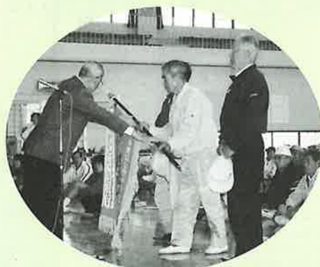
今年優勝した長寿チーム

今年は民生委員、ライオンズクラブ、婦人会、中学校、高校、大学などからボランティアとして参加していただいた方が多く(なんと80名以上!), ボランティア同士の交流もできてよかったと思います。また来年も、皆さんで楽しめる競技を考えていこうと思いますのでお楽しみに!