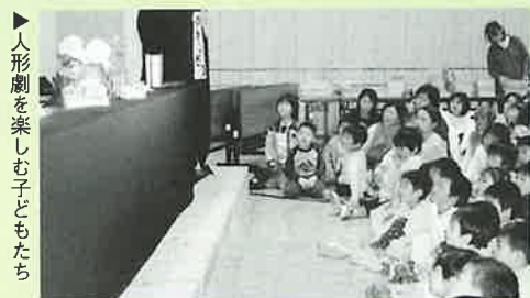
▲人形劇を楽しむ子どもたち