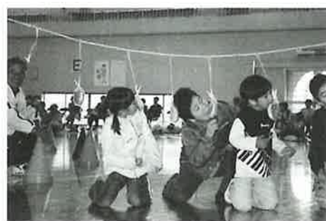
大人気だったパン食い競争 (来年もふるってご参加ください)