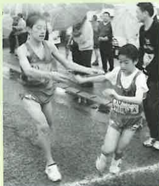
▲雨の中力走をみせる選手たち

また、桜づつみでは雨の降る中、駅伝大会が行われ、びしょ濡れになった選手たちが懸命の力走を見せました。