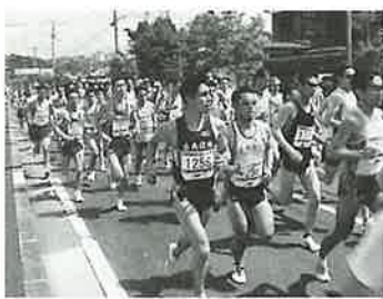
▲560名が一斉にスタートした10キロの部