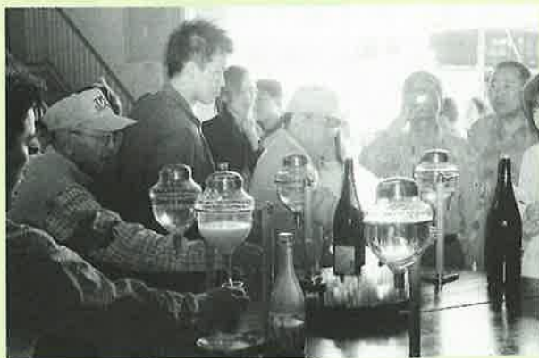
▲試飲を楽しむ来場者