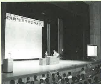
▲多くの聴衆をうならせた青少年意見発表会

1月9日、「地域の特性を生かし、一人ひとりが輝くまちづくりをめざして」をテーマに、第4回生涯学習のつどい「まなびフェスタ i n はさみ」が開催されました。