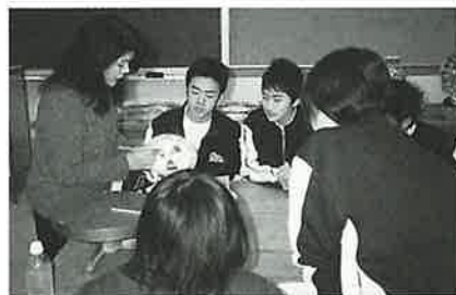
▲伝統工芸士に学ぶ