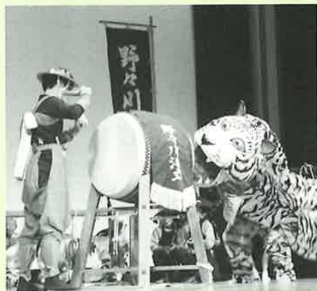
▲アトラクションで披露された町無形民俗文化財「野々川浮立」