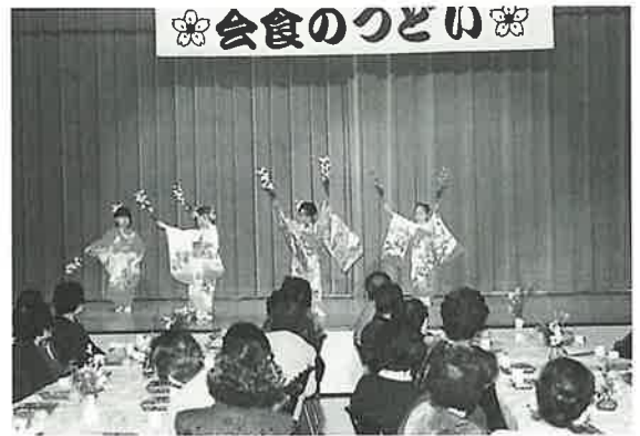
園児によるお遊戯

なお、開催にあたり小鳥居病院様、長生苑様、オートピア様、魚博様にマイクロバスのご協力を頂きました。ここに厚くお礼申し上げます。