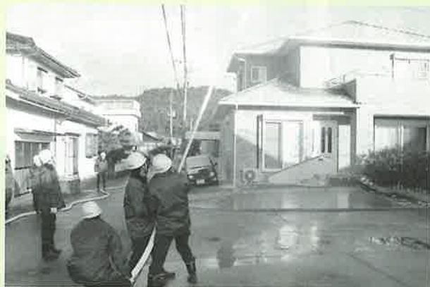
▲町消防団第2分団(管轄区:折敷瀬・井石)の水かけの様子