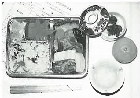
給食ボランティアの方が腕によりをかけて作られた会食のお弁当