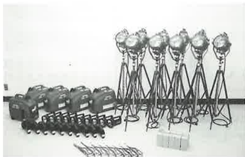
宝くじは、広く社会に役立てられています