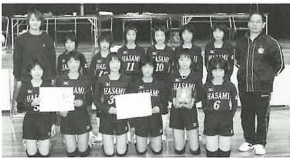
▲準優勝した波佐見中央JVC