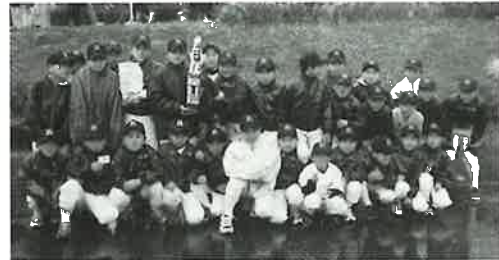
▲優勝した鴻ノ巣少年野球クラブ(全メンバー)

第4回スポーツ少年団駅伝大会が3月6日、田ノ頭郷の河川公園で開催されました。大会には町内の野球、サッカー、剣道、陸上等のクラブから45チームが出場。家族の方々の声援の中、健脚を競いました。結果は優勝が鴻ノ巣野球A、準優勝が東小サッカーAでした。