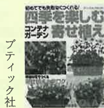
四季を楽しむ寄せ植え

余計なことして死にかけた、恥ずかしさのあまりに死にそう。コンパクトに手に汗握る、低レベルな臨死体験。2500万ヒットのホームページ「Webやぎの目」の人気コーナー「死ぬかと思った」第5弾。