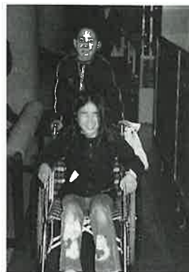
車いす介助、できるかな