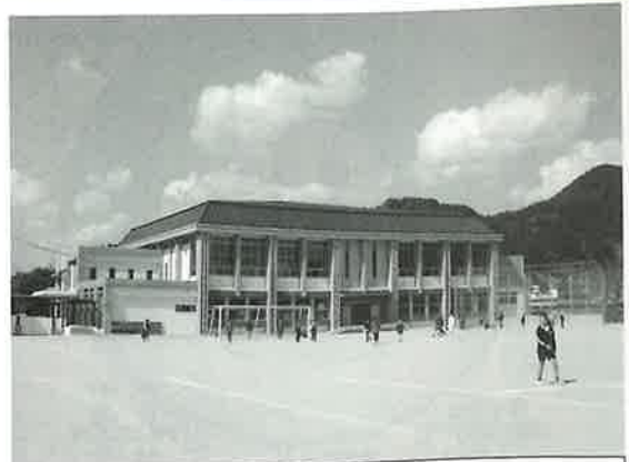
3月に完成した東小学校屋内運動場