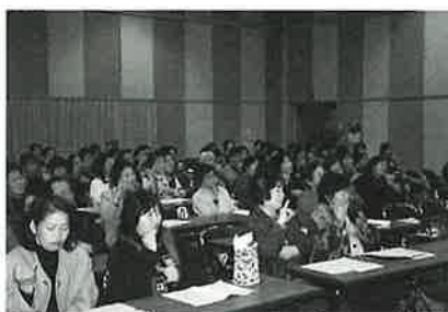
参加者全員で手話の合唱