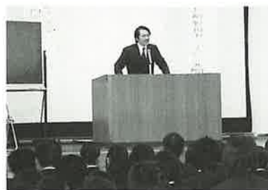
▲「進路講演」改善センター

2月中旬、1・2年生を対象に「進路ガイダンス」を行いました。これは、早期に進路意識を高め充実した高校生活を過ごさせることをねらいとしたものです。当日は「出会い・夢・実現」と題した全体講演の後、大学・公務員・専門学校・就職など各自の進路希望別に講話や個別説明会に参加。生徒達は、希望実現に向けて何をすべきかを学び、気を引き締めていました。