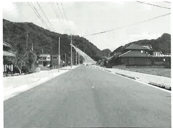
整備が進む都市計画街路 (湯無田地区)