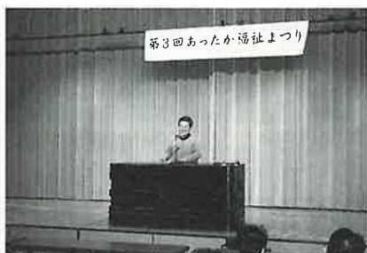
はさみ THANK.YOU 会の活動紹介

この日はボラ連会員と、一般の方々約110名の参加がありました。3回目となった今回は、ボラ連8団体【給食サービス（たんぼぼ班・すみれ班・ひよこ班）、波佐見ライオンズクラブ、波佐見町シルバーボランティア連絡会、はさみ・THANK.YOU会、手話サークルゆびのわ、点訳ボランティアでんでんむし】の活動紹介と、手話・点字・アイマスク・車いす・流動食の福祉体験を行いました。会員の皆さんは、自分が所属している団体以外の活動について知ること、相互交流を深めることができました。また、福祉体験はグループにわかれて約30分ずつの時間で行いましたが、時間はあっという間に過ぎていったようでした。