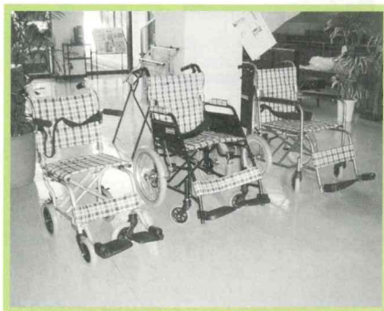
左：携帯用車いす 中央・右：介助用車いす