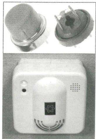
「においセンサの身近な実用例」 (上:既存のセンサ素子、下:市販のガス漏れ警報機)