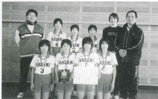
▲準優勝の波佐見中央小JVC

なお、試合結果は女子で波佐見中央小JVC(A)が準優勝、南小JVC(A)が3位となりました。