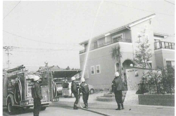
▲町消防団第1分団(管轄区:宿・金屋・田ノ頭)の水かけの様子