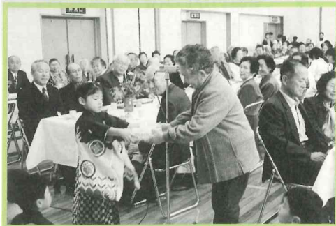
園児へお礼のおみやげを