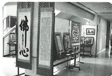
様々なジャンルの作品が出品されました