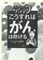
NHKためしてガッテン こうすればがんは防げる

がんってどんな病気?発がん物質って何?日本人の死亡原因第1位の「がん」について、マンガでわかりやすく解説。健康レシピ集やがん辞典も収録。NHKためしてガッテン「がん徹底予防術」を基に構成。