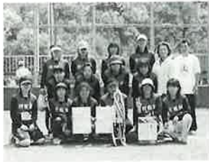
▲優勝の折敷瀬チーム

6月8日(日) 鴻ノ巣グラウンドで第25回婦人ソフトボール大会が開催されました。珍プレー、好プレーもあり、終始和やかな雰囲気の中、白熱した試合が展開されました。決勝は、折敷瀬と村木の対戦となり、投打にまさった折敷瀬が優勝に輝きました。