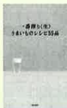
一番搾りへ生 うまいものレシピ55品

おんたまくんたま、鍋底大根、きんちやくなすのぬか漬、春だこ、だだちゃ豆など、問い合わせ殺到のキリンビール一番搾り「生」のCM・うまいものシリーズのレシピ集。CM絵コンテ付き。