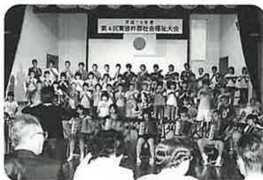
6年生72名の演奏に会場は圧倒!