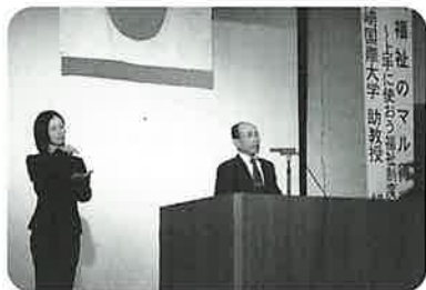
老人クラブ会員の立場から意見発表

参加者は今後の福祉の在り方について期待や理解を深めることができた大会だったようです。