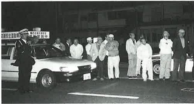
▲5月に川棚町で行われた「高齢者交通安全教室」

飲酒・暴走運転による交通事故は被害者も、加害者も、その家族にも悲惨な結末を迎えることとなります。飲酒・暴走運転の危険性、重大性や事故後の結果について認識し、また、交通社会の一員として自覚を持ち、飲酒・暴走運転は絶対にやめましょう。