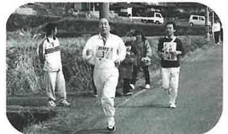
▲議員さんも頑張りました