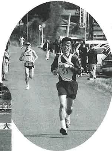
▲優勝へ向けてラストスパート