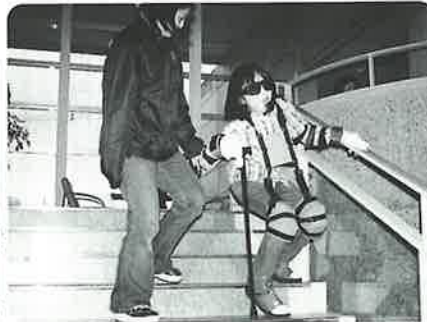
用具を使って高齢者の状態に…思いやりの心がパツ