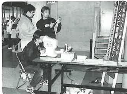
動体視力のチェックたくさんの人達が体験できました