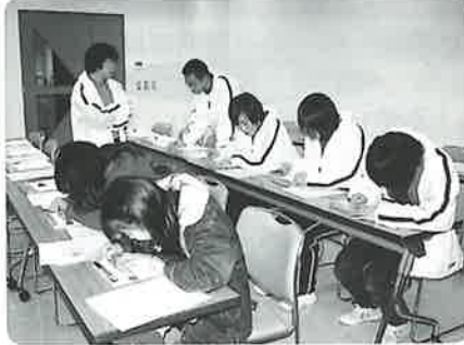
コツコツ…自分の名前打てるって嬉しいね！