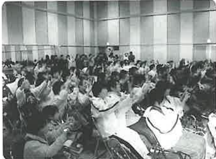
小さな古時計…会場いっぱいに手話の歌