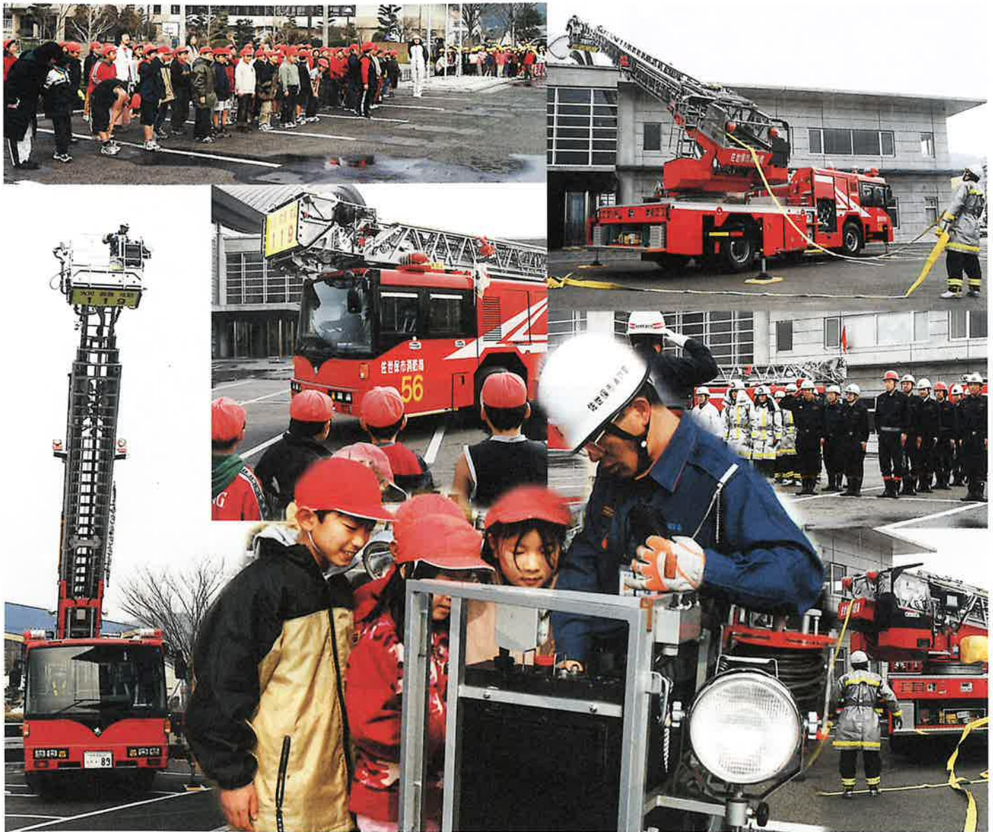
2月19日、総合文化会館内での火事を想定した消火訓練と人命救助訓練に佐世保東消防署から消防車とはしご車が出動して行われました。消防署員の機敏な動きと初めて見るはしご車のかっこよさに、この日見学を訪れた中央小学校の児童からは、「わあ、すごい！」という歓声が沸き起こっていました。