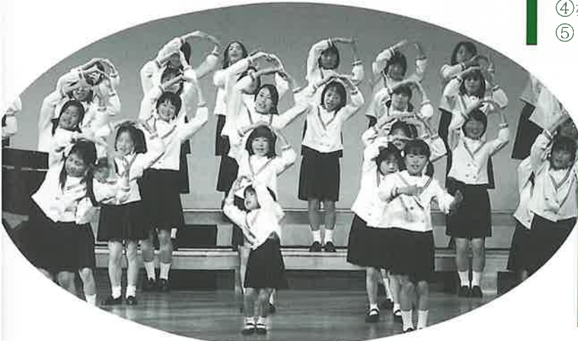
波佐見児童合唱団