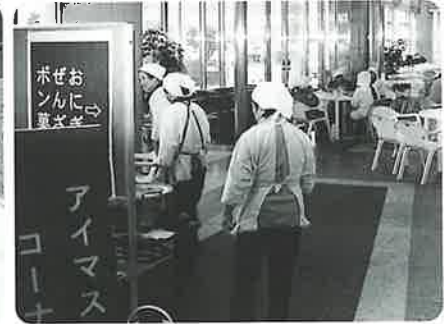
おいしかったね、おにぎり・ぜんざい・ポン菓子