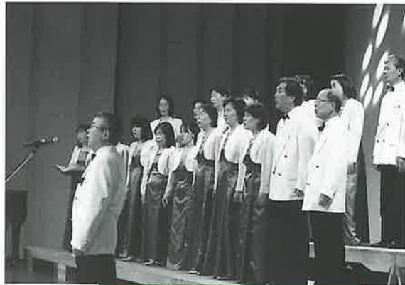
波佐見混声合唱団