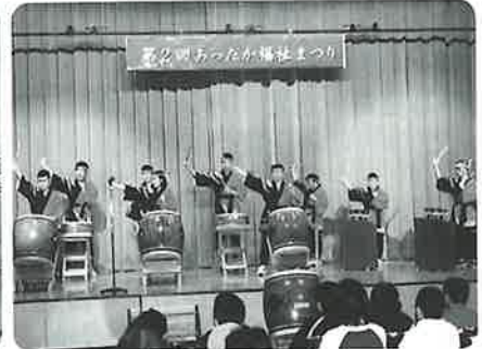
エイヤー！ 慈光園の皆さんの演技に大きな拍手！