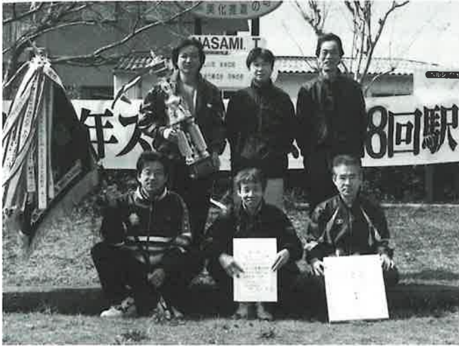
▲優勝した協和喜び組のメンバー

レースは終盤、昨年同様、協和郷と村木郷の一騎打ちとなり、勝負の行方はアンカーへと持ち越されましたが、1月に行われた町一周駅伝大会優勝で波に乗る協和郷が一步抜けたし、見事初優勝。村木郷の12連覇を阻止するとともに、町一周駅伝に続き、2冠を達成しました。