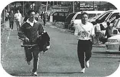
▲服持ちさんもゴールまで快走!?