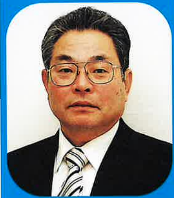
波佐見町長 一瀬 政 太