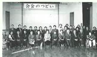
晴れやかな笑顔でハイ、チーズ!