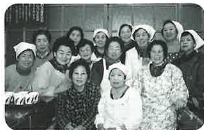
あったかい笑顔で、おいしい手作り料理ができました

ウンドゴルフの達人であつたり、手芸の本格派であつたり、ピカッと光るアイデアマンであつたり…と、とても素敵な方々の集まりです。