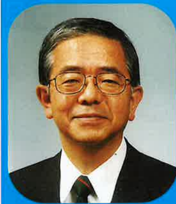
長崎県知事 金子原 二郎