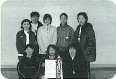
▶クローバーAチーム