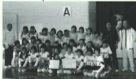
▶準優勝した波佐見南JVC

町内外から30チームが参加して第14回波佐見JVC親睦バレーボール大会が12月1日、勤労者体育センターなど4会場で開催されました。今回は男子も6チーム加わって過去最多のチーム数となり、3セットまでもつれ込む白熱した僅差の試合が数多く見受けられ、会場の割れんばかりの声援で盛り上がりました。なお試合結果は、波佐見南JVC(A)が準優勝、東(A)、中央(A)はともに3位という結果でした。