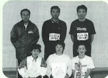
▶ハッピー会チーム