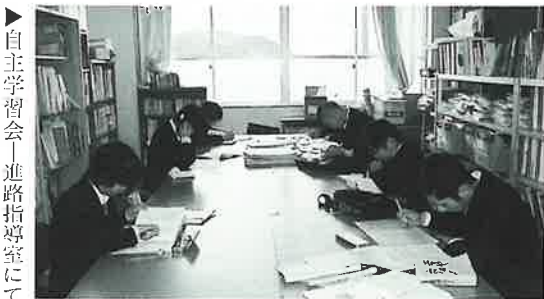
▶自主学習会―進路指導室にて

3年生にとつては、いよいよ進路決定の時期になり、それぞれの希望実現に向けて全力投球しているところです。就職は、昨年にもまして大変厳しい状況にありますが、本校の就職内定率は、12月現在で84%。これは県平均を大きく超えており、大変よく健闘しています。大学進学もいよいよ大詰めを迎え、休日返上で自主学習会に臨んでいます。