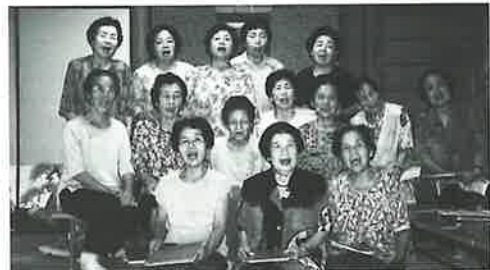
今日もハツラツとした歌声が響きます

カラオケサロン【あけぼの会】…地域での長いお付き合いの方向士が、歌を通してホッと寄り添える、そんなやすらぎの場になってきたようです。