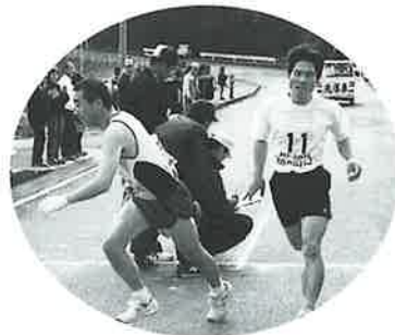
トップで中継 宿A 6→7区

4キロ。し烈なトップ争いだが、協和Aと折敷瀬Aはトップとの差をつめられないまま最終区へつないだ。