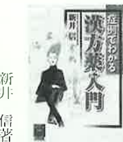
新井 信 著

お風呂こそ健康の決め手! 体のためになるお風呂の入り方を絵入りで紹介。冷え症や生理痛、胃のトラブル、不眠など、症状別のお風呂の入り方や快適なお風呂を楽しむための安全な入り方を解説する。