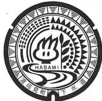
下水道マンホール蓋のデザイン