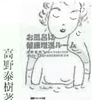
高野 泰樹 著

ペットとして動物を飼う人が急増し、それとともにペットから人にうつる「ペット感染症」も増えてきている。イヌやネコ、鳥などからうつる病気を解説し、人と動物が楽しく生活するためのポイントを紹介します。