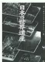
堀 ちと文 著

検査データで異常が認められないさまざまな自覚症状に対して、それを治療することを目標とする漢方医学。漢方の考え方を紹介し、胃腸や女性の病気、アレルギー疾患、ストレス等症状別にその効力を解説する。