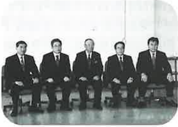
初会議を行った5市町長