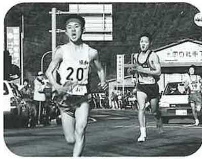
1区 トップの競り合い