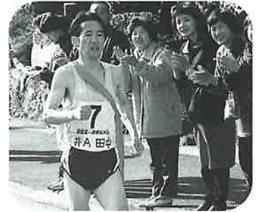
4区 地元の声援を受けて 井石A

各チームともエース級の選手が顔を揃える中、森浦好雄(宿A)が2位の協和Aに50秒の大差をつけ6区へたすきをつなぐ。トータルでもこの時点で宿Aが2位の協和Aに28秒の差をつけてトップに立った。