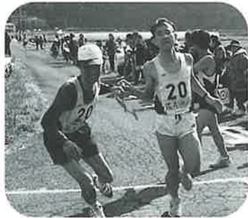
追い上げなるか協和A 5→6区