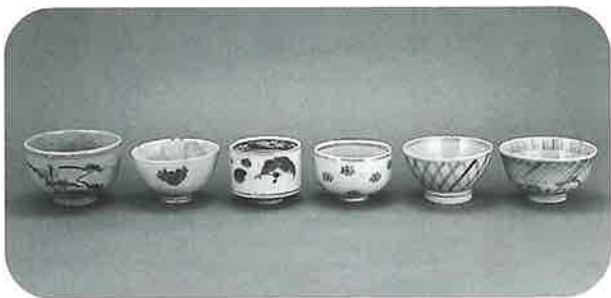
○さまざまな「くらわんか茶碗」

代表的な製品には、江戸時代の庶民向けの器である「くらわんか茶碗」や、輸出用の酒や醤油を容れる瓶である「コンプラ瓶」があります。1640年代から1929年まで、およそ290年間使用されていました。