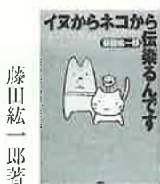
藤田 紘一郎 著