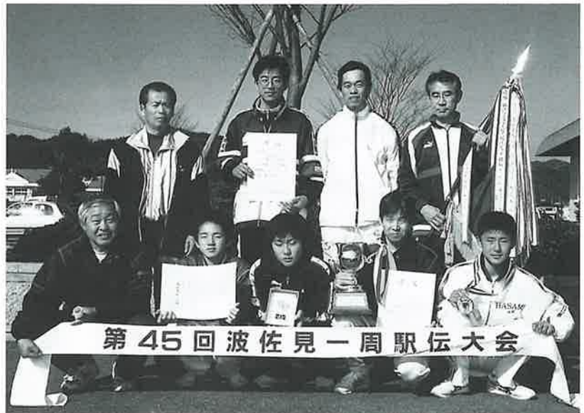
優勝した協和Aチーム

第45回波佐見一周駅伝大会が、町制45周年記念として、1月21日波佐見中学校前をスタート・ゴールとするコースで開催されました。気温、湿度とも申し分のない絶好のコンディションに恵まれ、各地区から出場した32チーム、224人が7区間、30.9kmのコースで健脚を競いました。 今年の大会は、戦国時代と呼ぶにふさわしい、力が均衡したチームが上位を争い、1位から4位までのタイム差が39秒という、最後までどのチームが優勝するのか分からない白熱した展開となりました。 結果は前半3位、後半2位でゴールした協和Aチームが初優勝、躍進賞は三股が獲得しました。 また、45回大会記念に際し、体育協会功労者や駅伝大会の功労者3名の表彰も行われました。