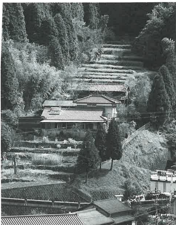
○中尾上登窯跡の全景

その規模から見れば、2基の窯跡は、「人類がなし得た偉大な業績」と言えるでしょう。また「世界遺産」や「ギネス・ブック」に登録されるだけの価値も十分あるでしょう。