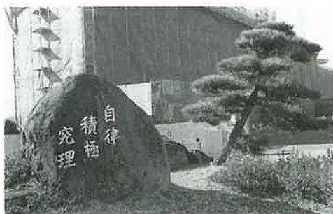
校舎もリニューアルします

波佐見焼窯400年を記念して、校舎東側の空地に「語らいの広場」の建設が進んでいます。昨年11月に始まった工事は、今年の卒業式(3月1日)までには完成する予定です。 この広場は、中央に窯のモニュメントを配置し、その周囲や煉瓦塀の壁面には、陶芸デザインコースの生徒たちが制作した陶板や作品を埋め込むこととしています。 まさに陶芸の町にふさわしい特色あるデザインとなっていて、今後は生徒たちの憩いや交流の場として親しまれることでしょう。 また、現在校舎の外壁補修工事も並行して行っていますので、完成しましたら地域の皆さんのご来校を心からお待ちしています。