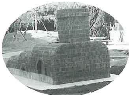
「語らいの広場」に建設中のモニュメント