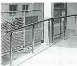
折湯集落センターに設置された手すり