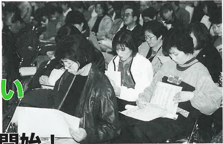
特定事業者への説明会（3月4日）