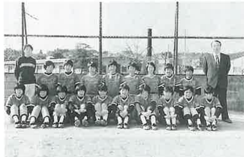
波佐見中学校ソフトボール部

3月27日から28日まで延岡市で開催される第10回全九州中学校男女選抜ソフトボール大会に出場する。