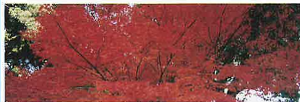
雑木林の中にひときわ映える紅葉を発見しました。(鹿山神社境内)