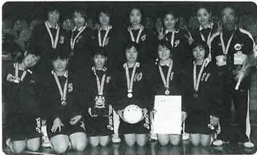
バレーボールチーム