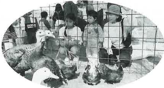
子どもたちにも大人気! (ミニ動物園)

好天気にも恵まれた11月8日、第17回農業感謝祭が農村環境改善センターで開催されました。 収穫を終えた農産物が勢揃い。新米やみかんの配布、牛肉やしし鍋コーナーなどに長蛇の列。 催しものでは、俵かつぎ、縄ない、ビール早飲み、大ビンゴ大会などが行われ、終日にぎわいを見せました。 また、今回は、ミニ動物園もお目見えし、子どもたちに大好評でした。