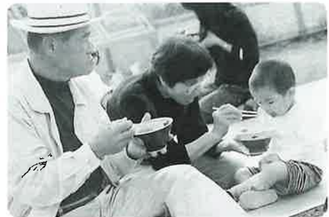
はじめて口にする しし鍋のお味は?