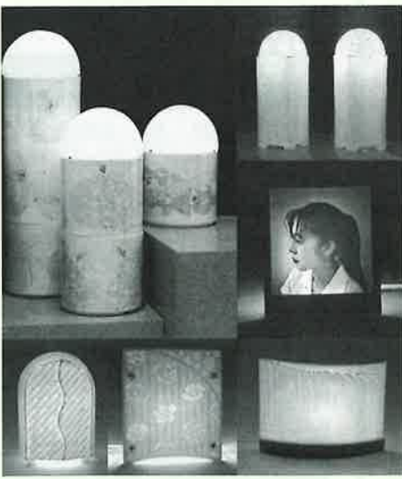
■画像処理による陶板、立体物