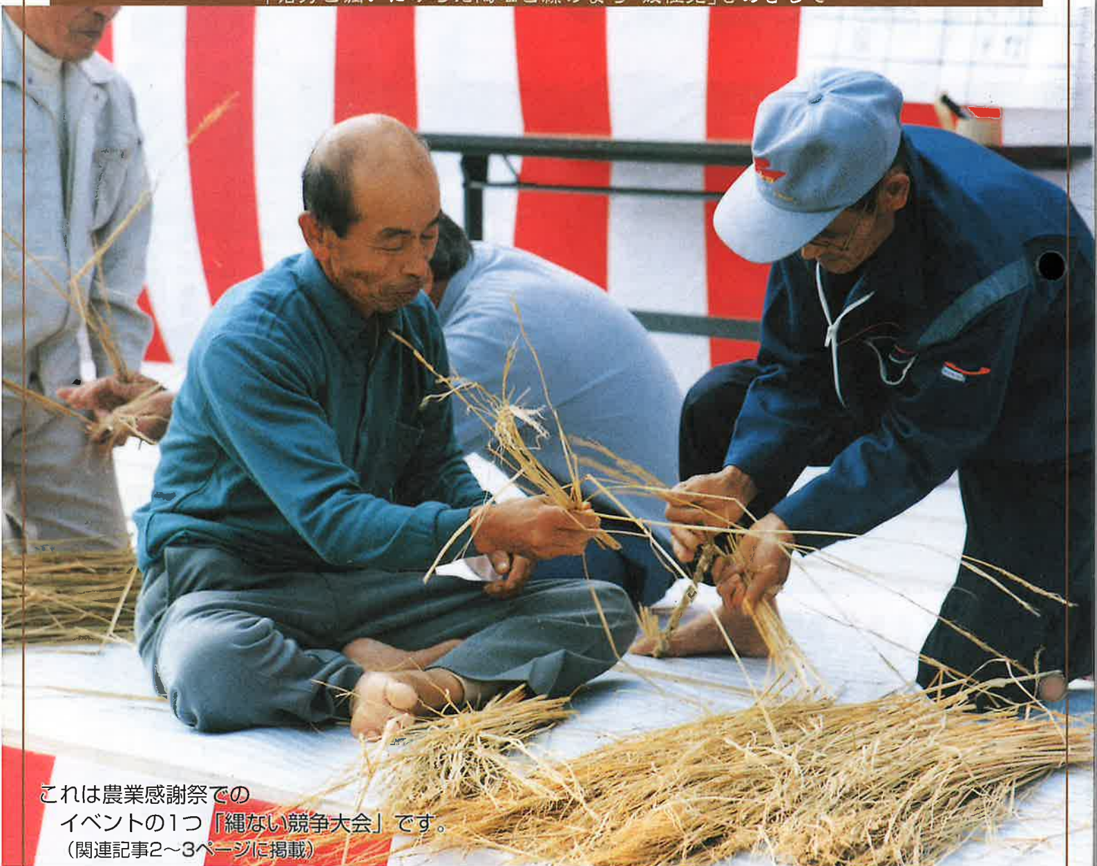
これは農業感謝祭での イベントの1つ「縄ない競争大会」です。 (関連記事2～3ページに掲載)