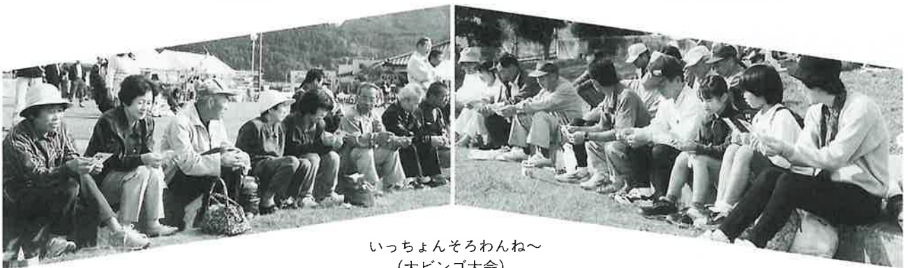
いっちゃんそろわんね～ (大ビンゴ大会)