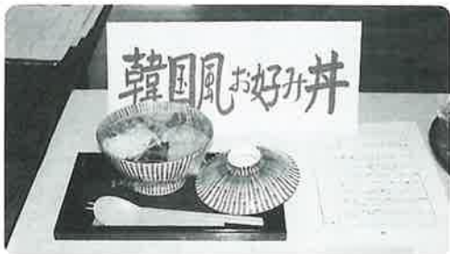
最優秀賞に輝いた 『韓国風お好み丼』