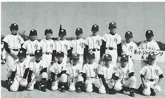
郡大会準優勝 東小ジャイアンツ