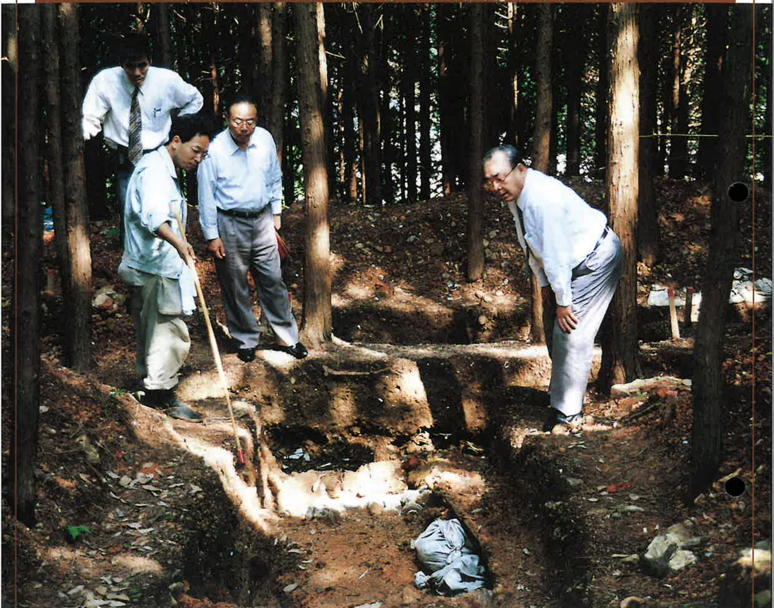
(関連記事5ページに掲載)