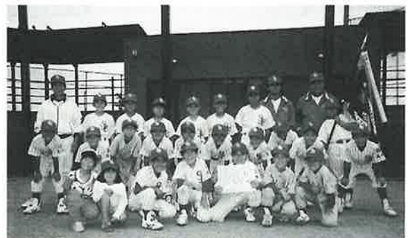
郡大会優勝 宿少年野球クラブ