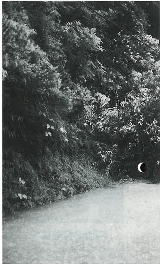
▲がけ崩れて通行止めに（野々川ダム付近）