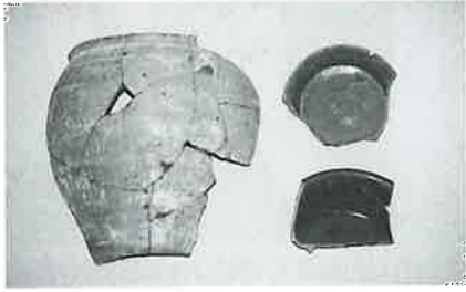
磁陶中国出土蔵本遺跡

中世（鎌倉・室町時代）の遺跡の発掘調査では、中国や朝鮮産の磁器が大量に出土します。また、町内でも、鎌倉時代の遺跡である岳辺田郷の蔵本遺跡の調査で、中国製の磁器が出土しています。このように、中世まで、磁器は、中国や朝鮮からの輸入品に限られていました。当時の日本には、磁器を生産する技術が無かったため