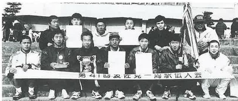
優勝した井石Aチーム