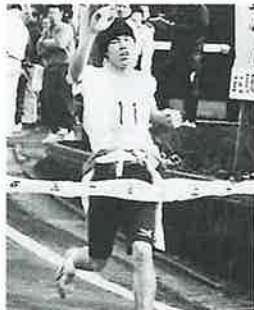
前半トップでゴール

中尾からの下りを走る前半最後の区間。このまま永尾Aの完全独走かと思われたが、宿Aがこれを阻んだ。宿Aのタスキは弟から兄へ。弟の区間3位の快走に應えるため兄細野健二は力走し、ゴール手前で遂に永尾Aを捕らえ、41