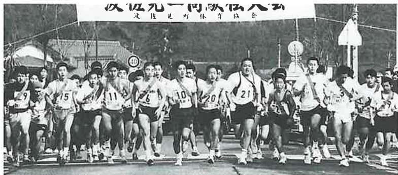
波佐見一周駅伝大会 波佐見町体育協会

新春の波佐見路を一本のタスキでつなぎひた走る「第41回波佐見一周駅伝大会」が、絶好の駅伝日和となった1月19日開催された。