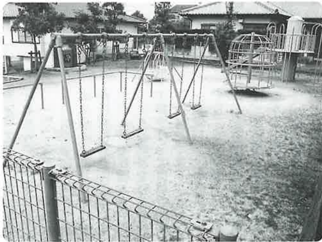
先生が本籍地を寄贈されてできた宿郷鹿山遊園地