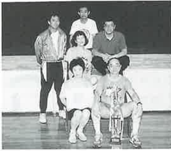
優勝した宿Bチーム

6月25日、勤労者体育センターで、町公民館主催のもと第6回ソフトバレーボール大会が行われました。この競技はバドミントンコートで1チーム4人と少数で気軽にできるもので、これまでチームの年齢編成を40代と50代としていたのを40代以上に変更、参加しやすいように幅をひろげました。今年は昨年より8チーム増え、23チームが参加。