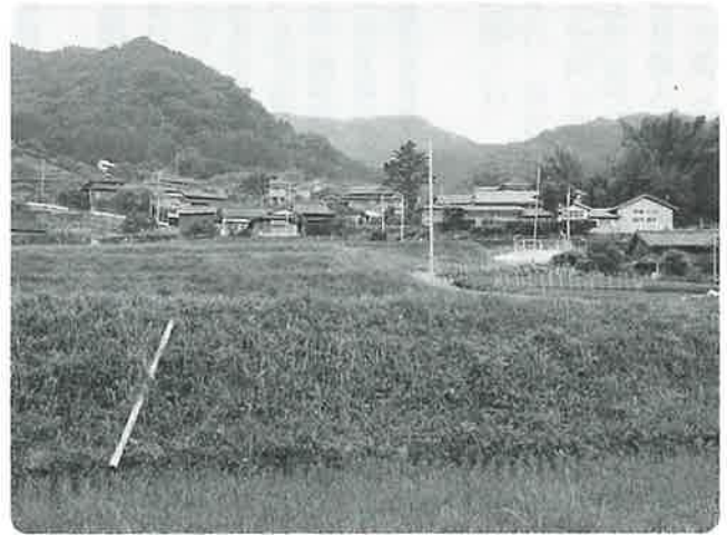
幼少のころを過ごされた鬼木郷