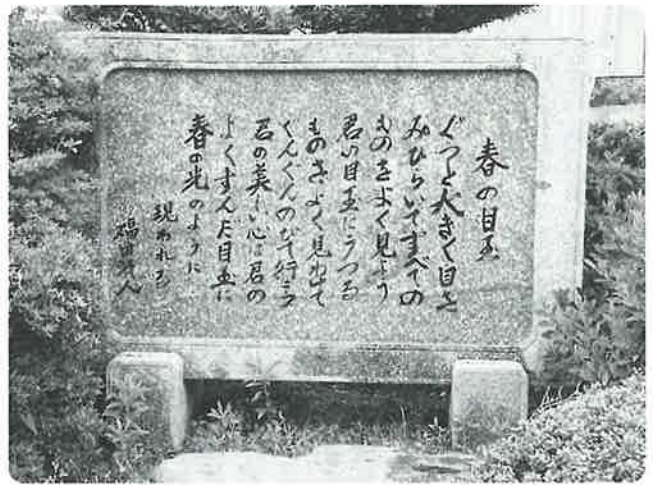
波佐見中学校に建てられている文学碑「春の目玉」