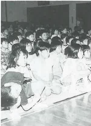
6月6日はさみ子ども劇場 人形劇鑑賞 (農村環境改善センター)