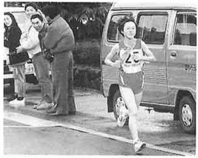
女性ランナーも力走