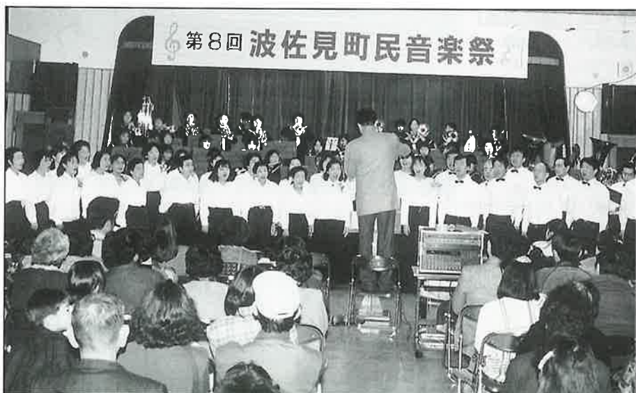
第8回 波佐見町民音楽祭