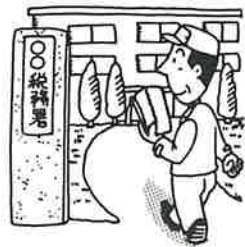
所得税の確定申告 (2月16日～3月15日)