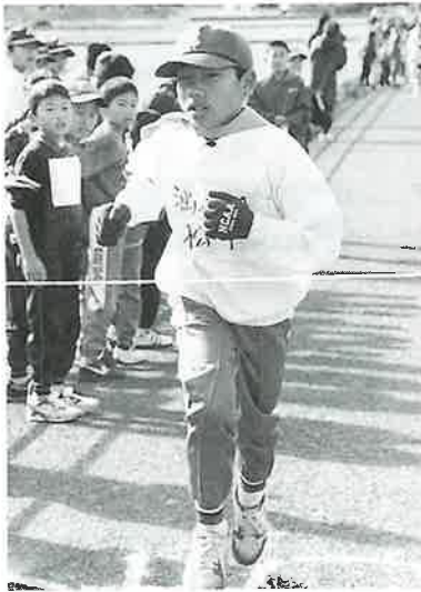
1月29日 学童野球連盟駅伝大会