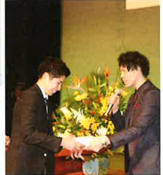
ビンゴゲームで長崎和牛おめでとう！