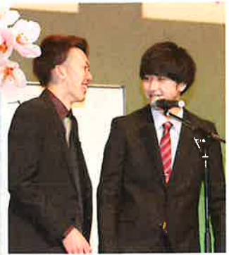
新春初笑い！新成人お笑いコンピ「よねやす」単独ライブ！