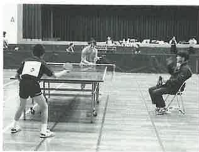
団体戦 折敷瀬対波佐見中日の対戦

第四十三回町民卓球大会が十一月二十五日、中学生や地域、職場などから約六十人が参加して、勤労者体育センターで開催されました。普段は対戦することのない中学生と一般の試合などもあり