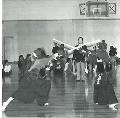
中学生団体の決勝 波佐見対彼杵