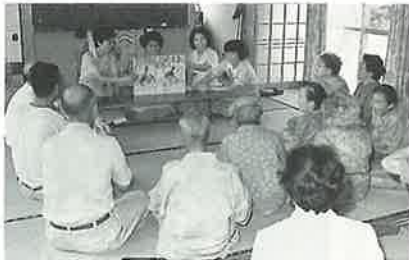
お年寄りを対象にした活動

「私たちの健康は、私たちの手で」をスローガンに活動している本町の食生活改善推進委員会に、活発な活動をしているとして、11月8日、知事から感謝状が贈られました。