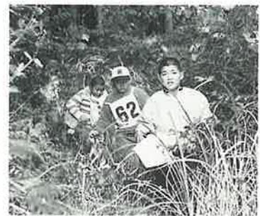
山の中も通りました

地図と磁石を頼りに、決められたコースを回るオリエンテーリング大会が、十一月二十五日、井石郷グラウンドを起点に開催されました。小学校の低学年コース、高学年コース、健脚コースにボイスカウトの隊員や親子など約八十人が挑戦。中尾方面や鬼木方面に向けて出発した参加者は、二、五人の組で行動し、途中に分かれ道があるところ、こつちの道さ、「いや、あつちぞ」などと言いながら地図で確かめていました。