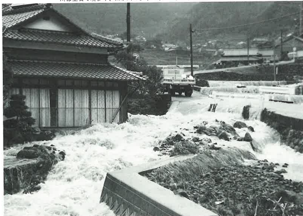
川は土石で埋まり、田が川ようになった。濁流が住家を直撃(鬼木)