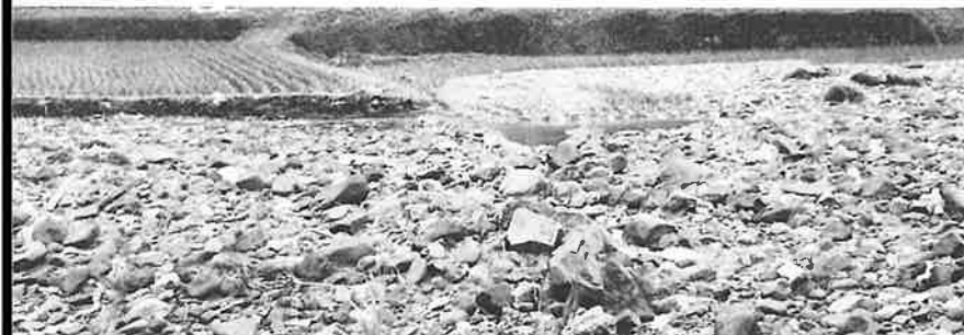
永尾、小樽、鬼木、川内など町内のあちこちで土石が田に流入した