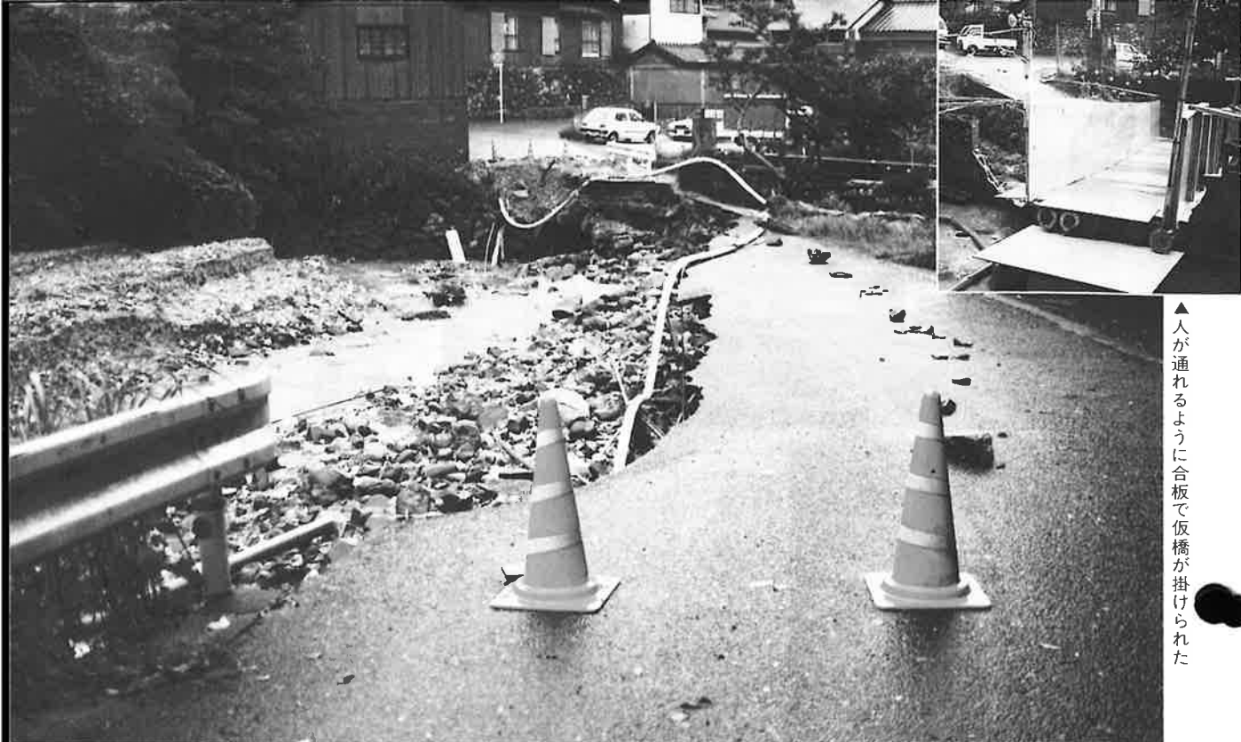
▲人が通れるように合板で仮橋が掛けられた