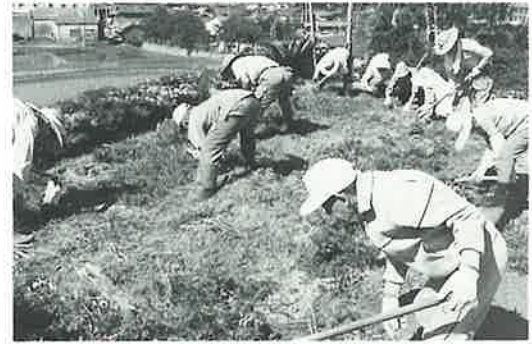
乙長野公民館の花壇整備