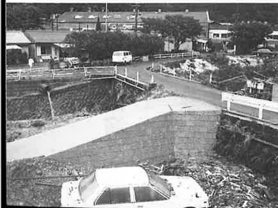
◀小樽郷小石原住宅前も二日の豪雨がうそのように静かだった(表紙と同じ場所)