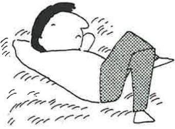
昼寝の時の夢問答でした。

じゃもん。何かオカシカもんな。 ヤブ オバチャンよう、あんな何がいつち心配な？ オバチャン アタシヤ足腰の痛うして…… ヤブ オバチャンよう、あんな足腰の痛かつたつちや死にやせんばつてん、あんなん体はそうとう無理しちよるケン、用心せんばツマランよ！あんな、話するたんびせーせーいいよつて、…坂道のぼつとキツカろが？ オバチャン へーサ、もう腰しや曲がチヨルし、ひざまでイタカし、トリドコロはなかですバイ…… ヤブ オバチャンよう、コリヤチツト用心せんばイカンバイ。足のムクミのあんもん。ちゃんといろいろ検査ばして治療ばせんと、後でキツカことにナルバイ。 オバチャン 私の病気は何ですナ？ ヤブ 血圧の高かケン、高血