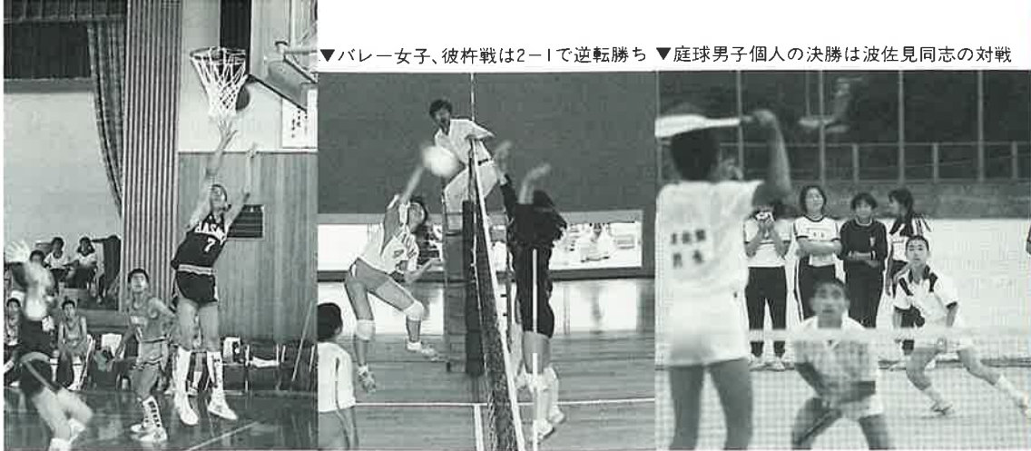
▶バスケット男子は見事優勝