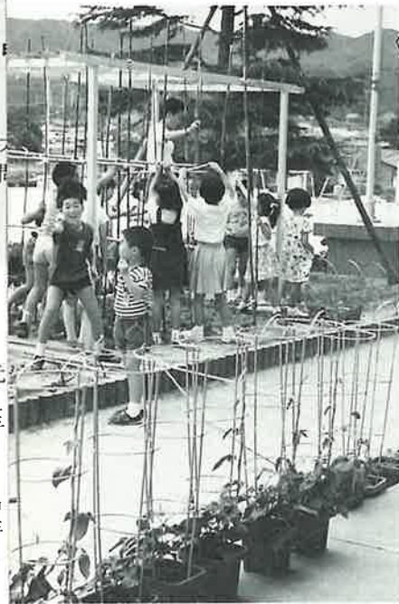
南小三年一組では、六月二十五日、学級花壇の手入れをしました。手前に並んでいるのは一年生の一人一鉢のあさがおです。

今年も、サルビアやマリゴールド、ペチュニアの花苗一万三千六百本が、町内の老人クラブや緑の少年団に配られました。 六月二十五日までにほとんどが植えられ、夏の花壇は花盛りです。 これらの花は、十一月ごろまでみなさんの目と心を和ませてくれるでしょう。