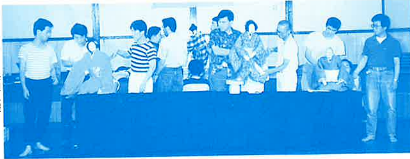
練習は毎週水曜日