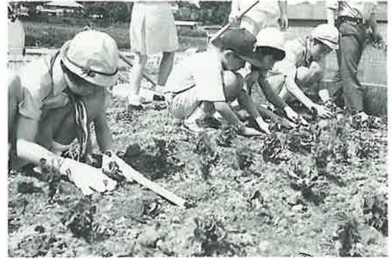
緑の少年団は改善センターに植えました