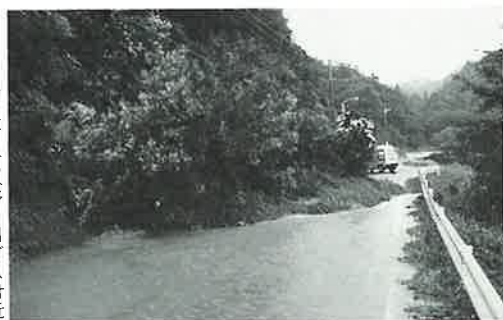
がけ崩れて通行止め(野々川ダム付近)