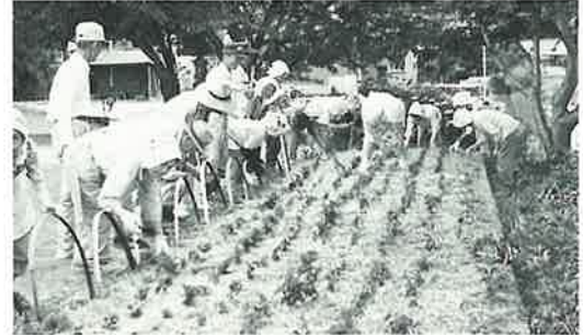
甲長野は25日に植えました

今年も、サルビアやマリゴールド、ペチュニアの花苗一万三千六百本が、町内の老人クラブや緑の少年団に配られました。 六月二十五日までにほとんどが植えられ、夏の花壇は花盛りです。 これらの花は、十一月ごろまでみなさんの目と心を和ませてくれるでしょう。