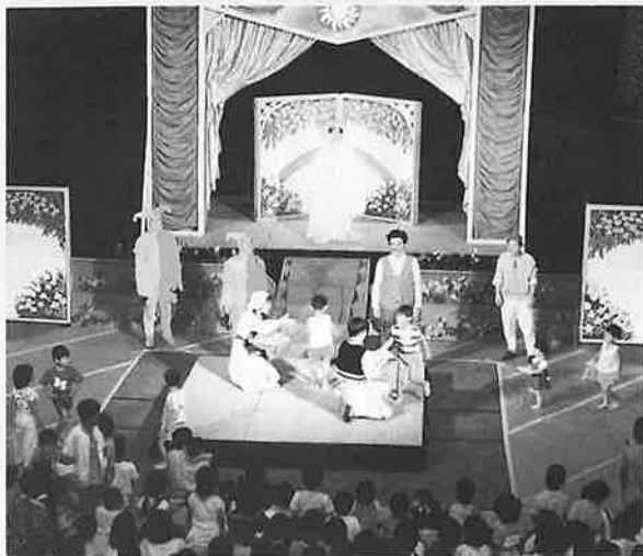
公演が終わって子どもたちからお礼の品が手渡されました