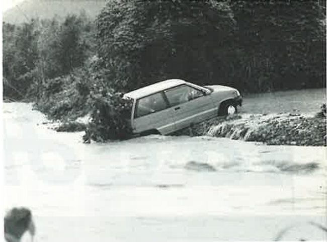
自動車が流される(湯無田)

七月二日、午前二時頃から強くなった雨は、四時三十分から五時三十分までの一時間に九〇ミリの記録。雨はその後降り続き、この日、一日の雨量は三六二ミリ、六月二十八日深夜からの総雨量は五三九ミリを記録した。午前五時、役場に災害対策本部を設置、防災無線により全町に警戒を呼び掛け、消防団も警戒にあたった。この雨により、河川のはんらんが相次ぎ、小樽郷小石原住宅などが浸水、住民が公民館などに避難した。堤防の決壊も多く、土石を含む濁流が田や道路にはんらん、道路の損壊、がけ崩れもあちこちで発生し町内の交通は一時マヒ状態となった。