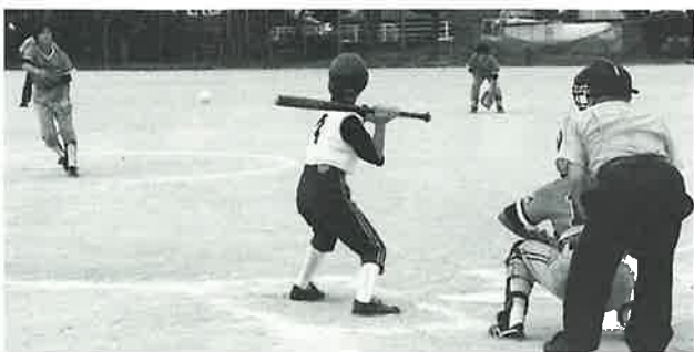
ソフト、対彼杵は53-0で圧勝