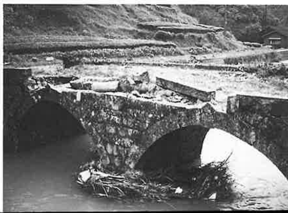
▶町文化財の眼鏡橋も破損