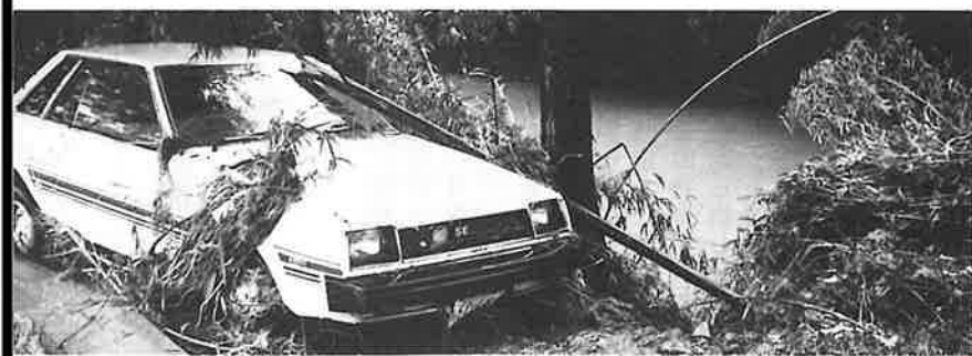
濁流に流された自動車が無残にも川岸の木に引っ掛かっていた(湯無田)