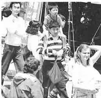
▲まわりがよく見えるヨ