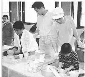
▲スジがいいですね