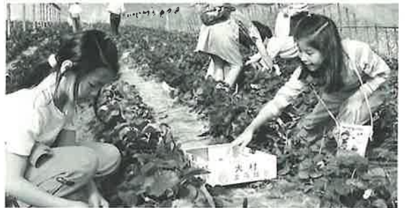
5月6日 いちご狩りを楽しむ少年団員