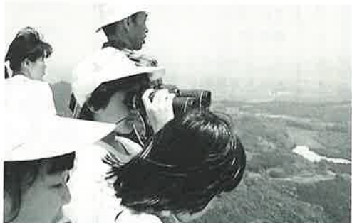
▲双眼鏡ではどこまで見えるかな