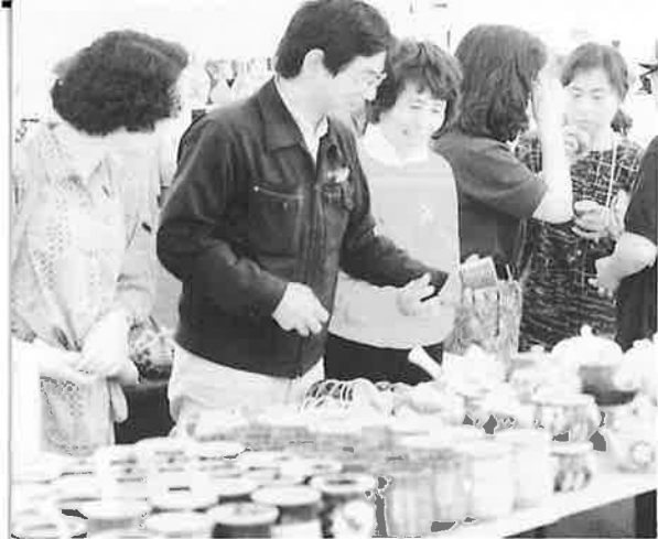
▲これもいいですよ(第2会場にて)