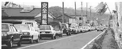
▲宿の県道も車の列(5月4日)