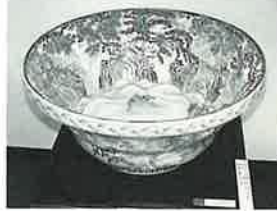
「内外山水大鉢」一瀬国重