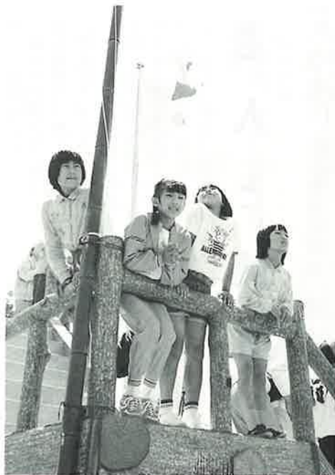
▲頂上は気分そう快

午前十時に鴻ノ巣公園を出発。協和から山中に入り、ニッ岳の山頂を目指します。途中、林の中や急傾斜の道を息を切らしながら歩き続けます。さすがに子どもたちは元気で、約四キロの行程を一番早かった子どもは四十分程で登りました。最後の人も、十二時頃には頂上に到着し、新装なっ