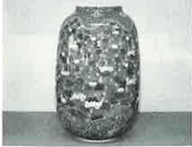
「染付水蓮詰絵」田村照利