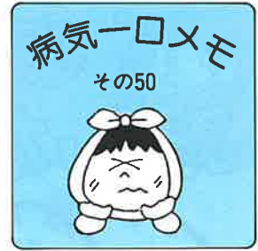
病気一口メモ その50

私たちの願いは、何といっても健康ですね。でも、ちょっとした油断でいろんな病気やけが見舞われることがあります。こんな時、お世話になるのが、お医者さん。