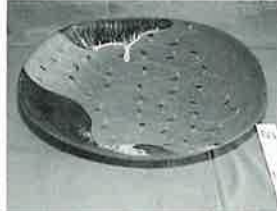
「象嵌四方鉢」立井清人