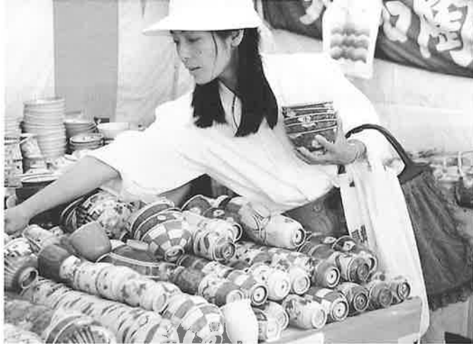
▲いいのがいっぱいありますネ