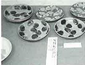
「野葡萄」紋皿 前川正義