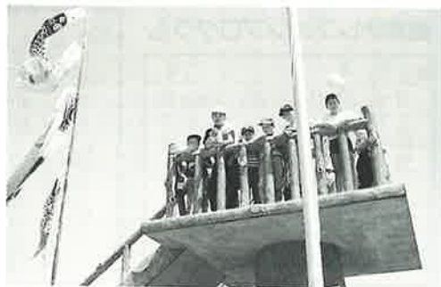
▲頂上にはこいのぼりも泳ぎました