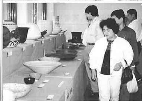
▲三千五百人が訪れた「ながさき陶磁展」