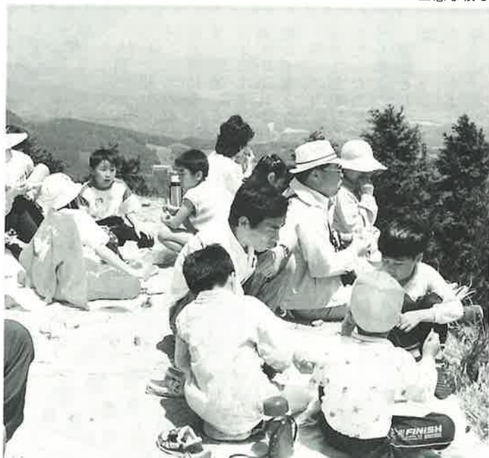
▲登ったあとみんなで食事

た展望台からまわりの景色を楽しんでいました。頂上では、はがきをつけた風船も飛ばされました。「前には、福岡まで飛んで行き、相手から電話をもらったこともある」とのこと、子どもたちは、青空の中へ舞い上がる風船に期待を込め、小さくなり、見えなくなるまで見つめていました。