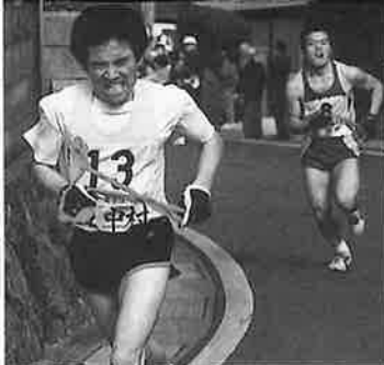
ラストスパート 中尾坂にて