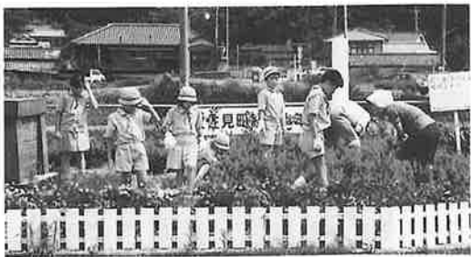
花壇の手入れをする団員

みどりのふれあいをおし、緑を愛し、緑を守り育てる心を養うとともに、自然を愛し、地域社会を愛する心豊かな人間として成長することを目的に、昭和五十九年、「波佐見町緑の少年団」が結成されました。 これまで、花壇の手入れ、巣箱づくり、植樹祭への参加、キャンプなどさまざまな活動を行っています。緑を愛し、植物を育てることによって育てられるやさしい心は、これからの社会では特に大切なもののように感じられます。 平成元年も、花壇の手入れ、