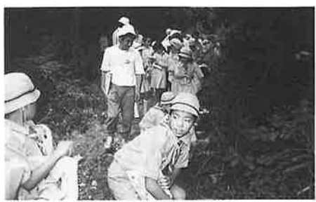
国立諫早少年自然の家での森林研修

世知原での「ふれあい森のつどい」への参加、国立諫早少年自然の家での「緑の少年団全県の集い」への参加などを実施し、団員にとっては楽しい経験をとおして、やさしい心が育てられているものと思えます。 今後、こうした活動の輪がさらに広がり、情操豊かな子どもたちが育ってくれることを願っています。 団員を募集しています。 緑の少年団では新しい団員を募集しています。対象は、小学三年から六年までの男女です。 詳しくは、役場商工企画課にお問い合わせください。