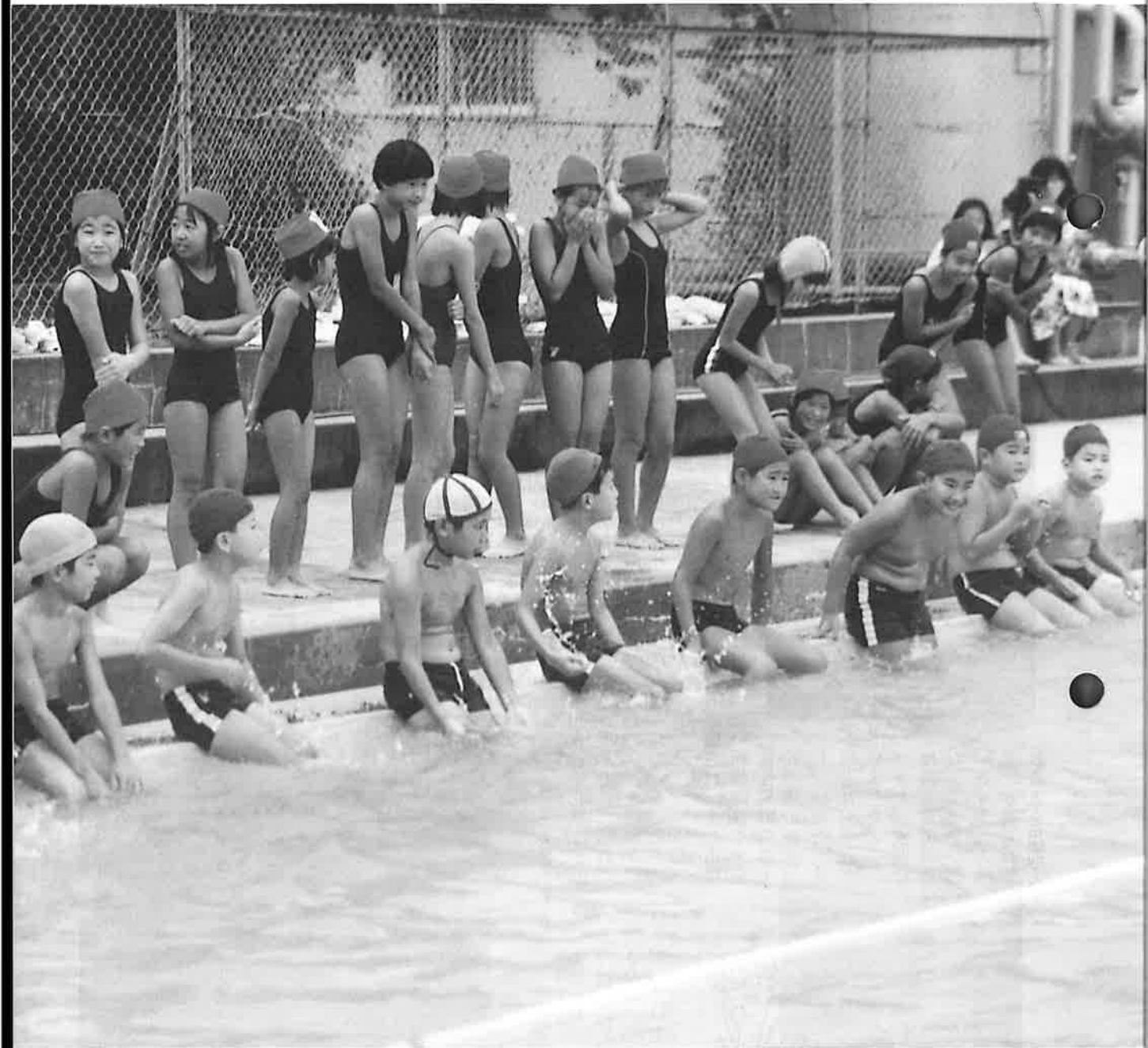
子ども水泳大会より