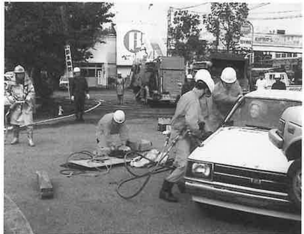
川棚駅前行われた事故処理の模擬訓練