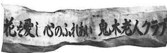
平成元年度町花壇コンクール結果