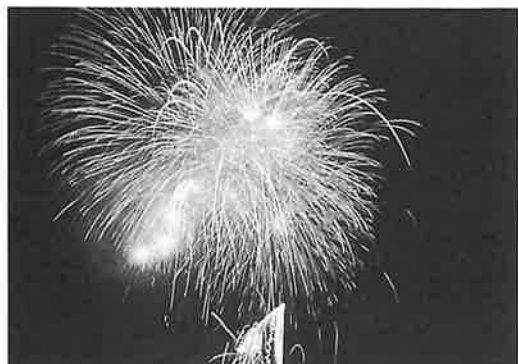
花火もきれいでした。

「第八回はさみ夏まつり」が、八月十四日に開催されました。 「皿みこし」に始まり、「道踊りコンテスト」「ミス選彰」「おたのしみ抽選会」などが次々と繰り広げられ、集まった八千人の見物客から歓声が上がっていました。最後には、二千発の花火が打ち上げられ、夏の夜空に大輪の花を咲かせました。