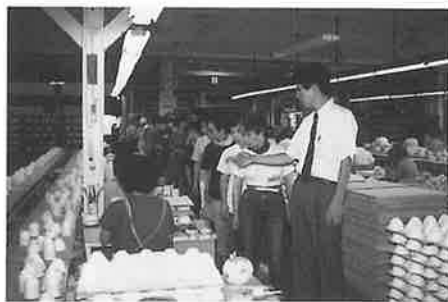
窯元見学 (重山陶器)

ありました。二日目は、ナシ狩り・金山跡見学の後、「陶芸の里」中尾山を探訪。窯元を見てまわり「山あいの狭い所に工場がたくさんあるんですね」と驚いていました。鬼木郷公民館では、手作りコンニャクの入った煮ものや赤ジンジャーなどの説明があると熱心にメモをとっていました。