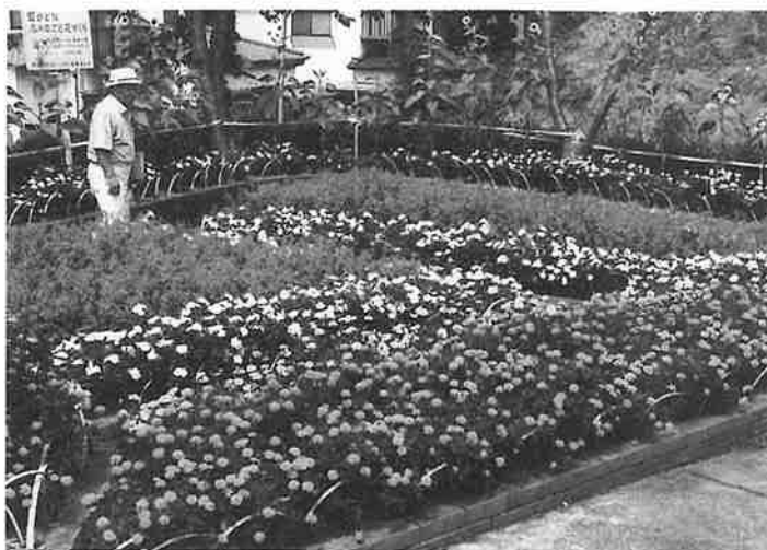
最優秀の舞相会館の花壇