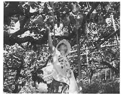
ナシ狩りもありました。

てしまう」と驚いた様子。長崎の主婦は「今年、ロクロを自分の家を買って作っているが、なかなか思ったようには出来ない。勉強になります。」絵付けでは、本格的に花の絵柄を描き込む人もあれば、簡単に描いた後、飾ってある陶板の絵を見て「こんなのを描けばよかった」と悔やむ人も