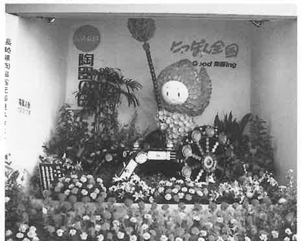
玄関に飾られた「花ずきんちゃん」

また、玄関には波佐見焼の皿などで作った「花ずきんちゃん」が飾られ訪れる人を出迎え