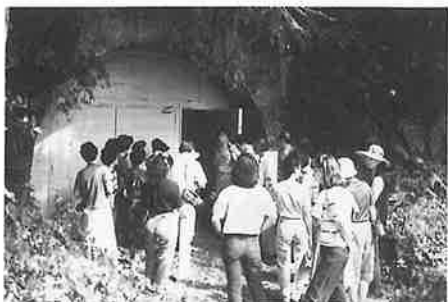
涼しかった金山跡

ありました。二日目は、ナシ狩り・金山跡見学の後、「陶芸の里」中尾山を探訪。窯元を見てまわり「山あいの狭い所に工場がたくさんあるんですね」と驚いていました。鬼木郷公民館では、手作りコンニャクの入った煮ものや赤ジンジャーなどの説明があると熱心にメモをとっていました。