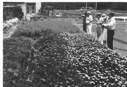
優秀の金屋公民館の花壇