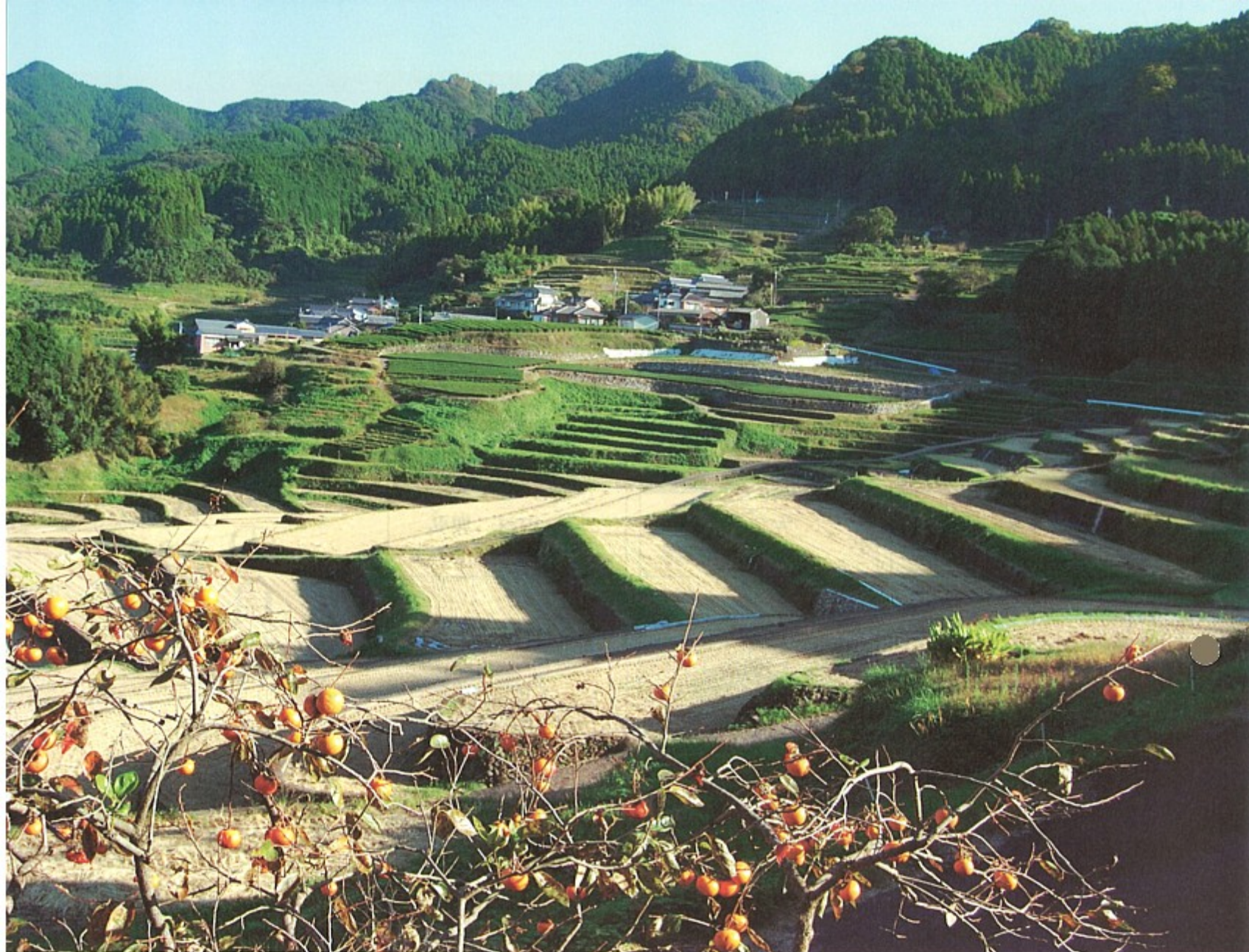
収穫を終え、初霜を待つ棚田（鬼木郷）