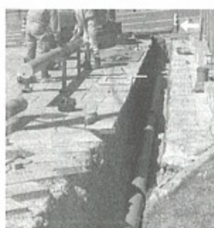
進められる工業用水道工事

について十分に協議を重ね、24年度に第一段階とし、浄水処理しない原水一〇〇〇立方メートルを供給する施設を整備する。 折敷瀬郷（内の波）を水源とする取水施設工事に、8月着工した。計画どおり25年4月工業用水供給開始に事業推進を強力に図っていききたい。 問 農地水保全管理支払交付金制度の利用促進と周知についてはどうか。