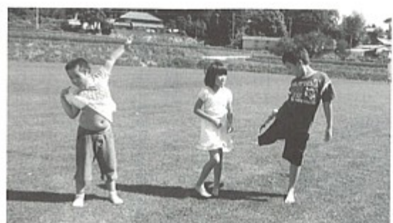
芝生で遊ぶ子どもたち(農業環境改善センター)

ある。テコ入れを考えるが、まずは業界のトップ会談や組合の合意形成が必要。 問 業界のトップ会談よりも「10年後はほとんどの火が消えている」と言われる山の声を真摯に聞いてほしい。 策定中の今後10年間の構想、「第5次総合計画」に町民の声を反映させるため、アンケート調査や公聴会の開催計画はないのか。 町長 先の「町政報告会」