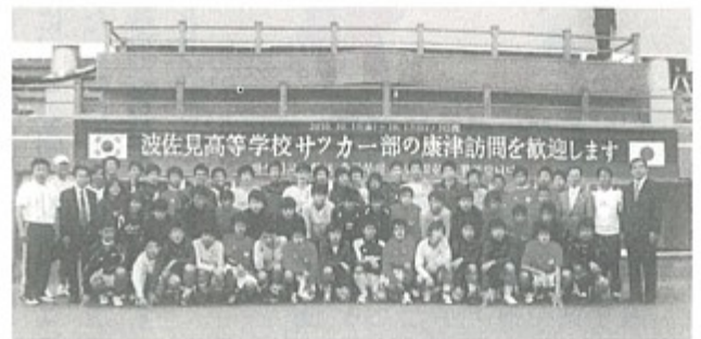
平成22年、波佐見高校サッカー部が訪問

スポーツ及び陶芸交流、自治体間の交流を行ってきた。しかし、先般、日韓両国の領土問題が再発し、日韓関係は厳しい状況となっているが、大局を見失うことなく、康津郡との交流はこれまでどおり進めて参りたいと思う。