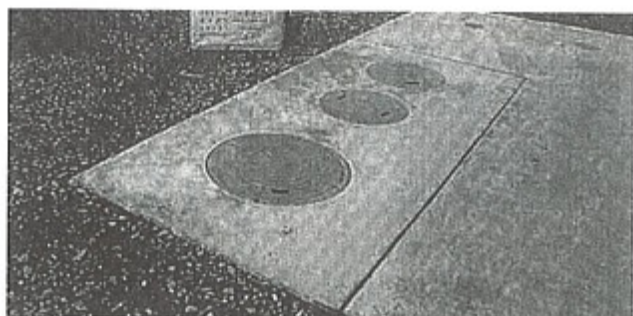
設置された合併浄化槽

年間40基程度で現在1145基が設置され、当然生活環境の改善と公共水域汚濁防止の観点からも制度の普及推進を図り、次期総合計画の中に盛り込むよう検討する。 問 野球場建設については再々要請している。実現に向け年次計画を立て努力すべきと思うがどうか。 教育長 子どもの未来に夢を与える野球場建設に賛同はするものの重点事業も山積しており、クリアするには困難であるが引継ぎ実現に向け努力したい。