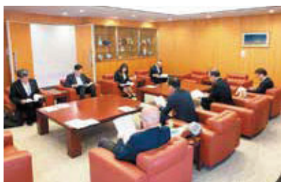
【副知事、担当部局との意見交換】