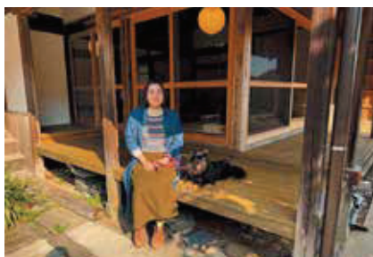
愛犬とキヨトテラスで