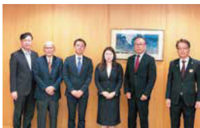
【馬場副知事(右から 3 番目)】