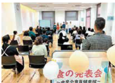
▲中央小「食の発表会」緊張した～！