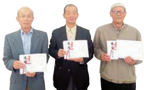
2位 小樽郷 1位 金屋郷 3位 皿山郷 【264,209 歩】 【380,341 歩】 【244,123 歩】