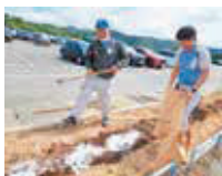
石膏肥料の施肥の様子

波佐見町ではやきものの製造過程で生じる石膏型のリサイクル手法として、石膏型を粉碎してできた石膏肥料「波佐見のめぐみ」の普及を進めています。この肥料は、カルシウムが主成分で、イモ類の栽培に適しています。