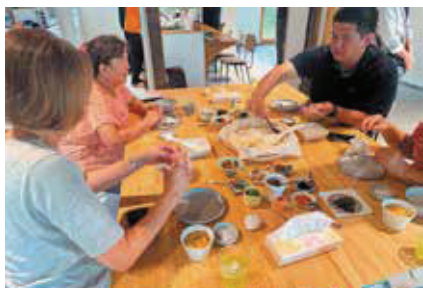
9月のイベントの様子

残りの任期も、地域の方々と一緒に楽しみながら、多くの方に喜んでもらえる場所にしていけたらと思っています。どうぞよろしくお願いいたします。