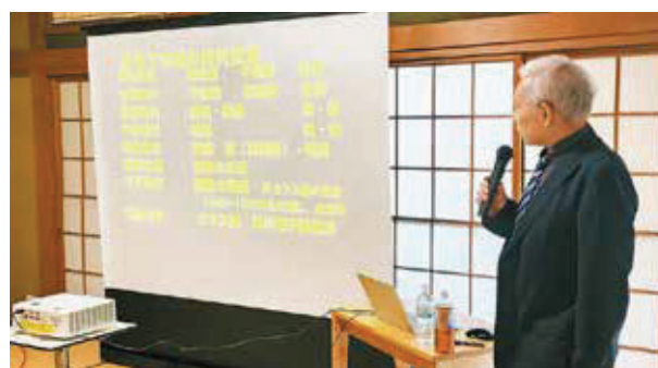
▲青木先生による講演