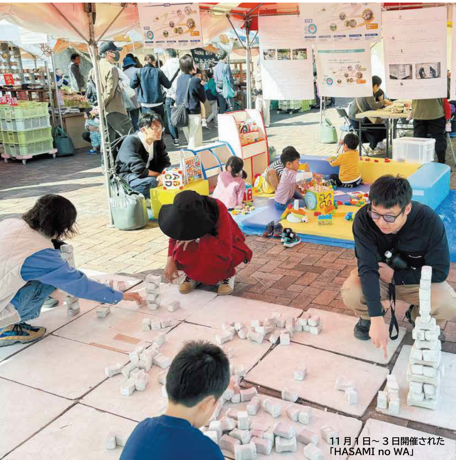
11月1日～3日開催された 「HASAMI no WA」