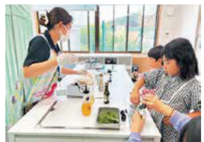
▲手作りドレッシングに挑戦