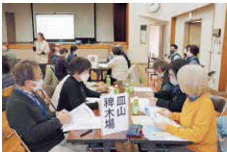
サロン交流会の様子