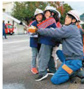
火点目掛けて放水開始