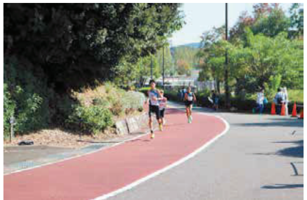
最終区 6 区の坂道を力強く走る選手

思うようにタイムが伸びなかった選手、それぞれが一つの櫂をつなぎ、最後まで全力をふり絞って力走する姿に、本当に心を打たれました。