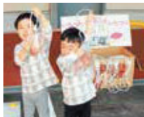
大きなイモが釣れたよ！