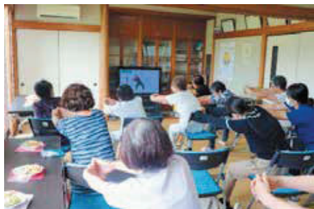
サロン活動の様子

また、活動費やサロン保険の助成に加え、代表者同士の交流を目的としたサロン交流会を開催し、サロン活動が円滑に進められるようサポートしています。「サロンを立ち上げてみたい」など関心がある方は、どうぞお気軽にご相談ください。