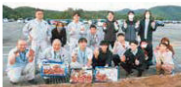
たくさん収穫できました！

収穫されたサツマイモは、11月8日開催の食育フェスタへ提供されました。「サツマイモ釣り」というゲーム形式で参加者へプレゼントされ、子供たちの笑顔であふれていました。