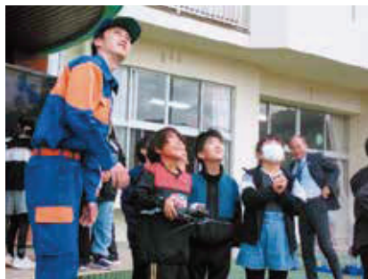
ドローンを上空 50 m 先へ