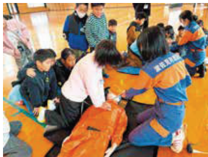
11/27 中央小 心肺蘇生