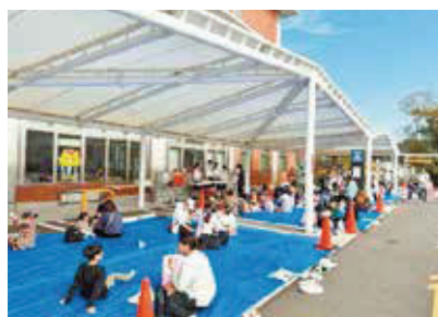
▲お日様の下で食べたみんな食堂