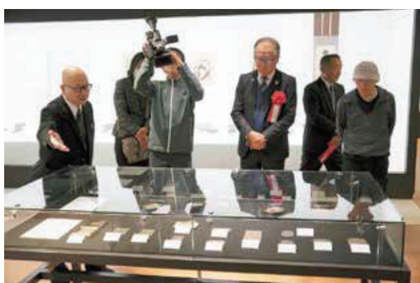
▲特別展を見学する関係者