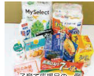
子育て応援品の一例