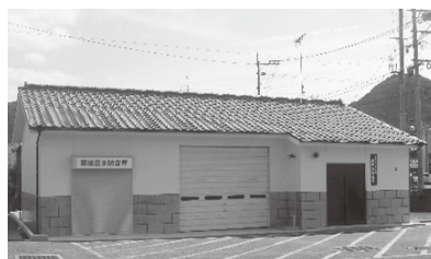
第4分団詰所・水防倉庫建替事業