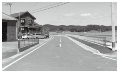
道路整備事業（町道長原線）