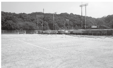
鴻ノ巣公園テニスコート改修事業