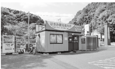
はさみ観光案内所整備事業