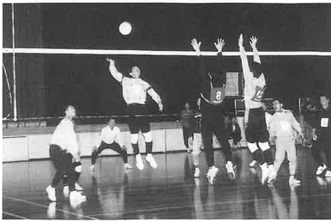
▲接戦のうさぎさん—野々川

男子は予選から白熱した試合が続きました。Aパートは、前回二位のうさぎさんが野々川に苦戦の末逆転勝ち、野々川は優勝した上山建設をフルセットで下し、三チームが一勝一敗で並びました。決勝へ