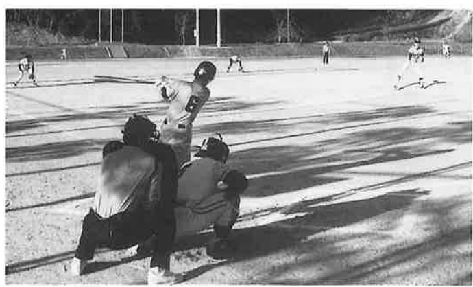
鴻ノ巣対ジャイアンツの優勝決定戦