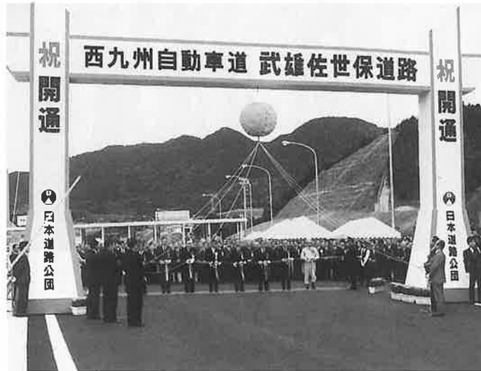
武雄南インターでのテープカット

県北地区にハイウエー時代を開く武雄佐世保道路（西九州自動車道）の波佐見一武雄間が、十一月三十日供用開始され、全線が開通しました。 昭和五十七年に建設開始され、昨年三月、佐世保大塔一武雄間の開通がまたれていました。来年一月二十六日に完成する九州横断自動車道・長崎自動車道と直結されれば、本町から福岡市までは一時間半程度で行けることになり、交通新時代を迎えることとなります。 西九州自動車道は、福岡市から佐世保市を通じて武雄市に至る総延長百五十キロの一一般国道自動車専用道路として計画されています。