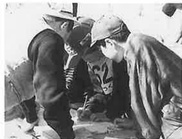
鬼木を通して金屋から… 地図で確認

歩くことの少なくなった今日、野外スポーツをとおして体力と健康増進をはかり、親子の触れ合いを深めてもらおうと、十一月二十六日、オリ