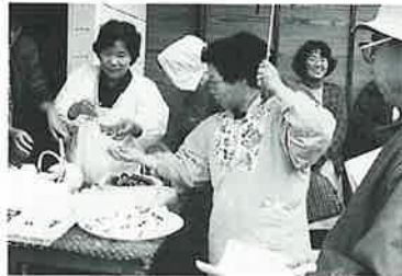
今年も平野婦人会員による湯茶接待