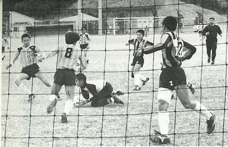
南小A対中央小Aの熱戦

第五回波佐見町少年サッカー選手権大会が、二月三日、鴻ノ巣グラウンドで町内の三小学校から八チームが参加して開かれました。 やや肌寒い一日でしたが、日ごろの練習の成果を發揮しようとする子どもたちは元気いっぱい走り回りました。 この日の最終戦は、Aチームの部の事実上の決勝となった南小と中央小の対戦。前半は、組織だった攻めの中央と速攻を仕掛ける南の激しい攻防が続きましたが、キーパーの好プレーもあり無得点。後半は風上に立った南がよく攻めました。中央のバックもよく守り、両チームとも無得点のまま終了のホイッスルが鳴りました。結局、得失点差で中央が優勝しましたが、どちらもよく練習ができていてすばらしい試合をみせてくれました。