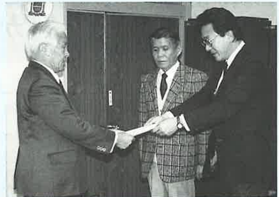
一月八日代理の人から目録が渡されました