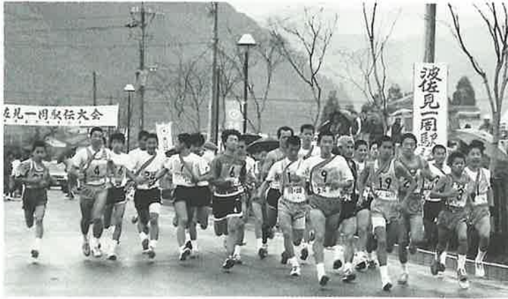
中学校前を一斉にスタート