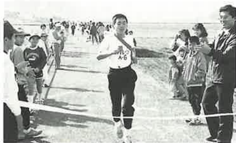
パイレーツA、トップでゴール