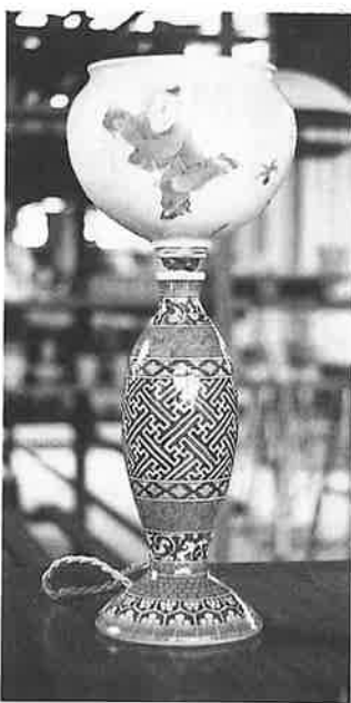
「唐子山水地紋傘付きスタンド」

試作を始め、今年六月に熊本で開催する個展に出品できるように準備をすすめています。が、その前に全国伝統的工芸品展への出品となりました。今回の工芸品展は、全国の伝統的工芸品約三百種四千点を集めて一月九日から六日間、東京・池袋の西武百貨店で開かれました。藤井さん親子の作品は「磁器のもつ透明性を巧妙に応用したデザインは出色・呉須の使用を球部と台部