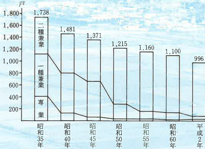
波佐見町の農家数の推移

「農林業センサス」といっても、農家以外の人には耳慣れない言葉だと思えますが、これは農家の国勢調査ともいえるもので五年に一回実施されています。昨年二月一日現在で調査が行われ、このほど概要がまとまりました。