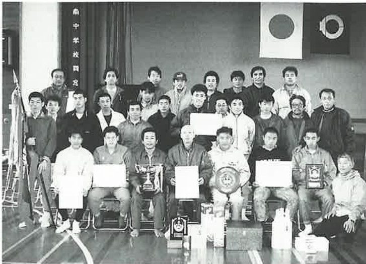
初優勝の宿チーム