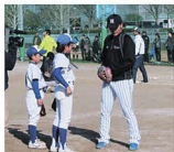
▲投球指導を行う松田選手

今回松田遼馬選手のご厚意でサインボールをいただきました！そこで広報波佐見では、このサインボールを町民の皆さんへプレゼントします！サインボールをご希望の方は、通常はがきに「サインボール希望」の一文と「広報波佐見のご感想」をお書きのうえ、「住所」「氏名」「電話番号」を書いて、他県企画財政課広報波佐見担当まで「応募」ください。締切は2月12日（金）（当日消印有効）です。ご応募お待ちしております！※プレゼントの対象は波佐見町民に限ります。（全ての必要事項の記入も必須条件です）また、1世帯1個までとさせていただきます。（ご了承ください）※応募者多数の場合は抽選とさせていただきます。当選者の発表は発送（2月下旬）をもって代えさせていただきます。