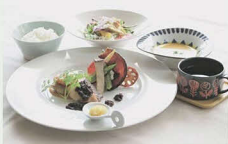
▲燻製帆立とコウロ鯛のソテー ～2種のソースを添えて～

スタンプラリーも同時開催！料理を食べてスタンプを集めて賞品(数量限定)をゲットしよう！