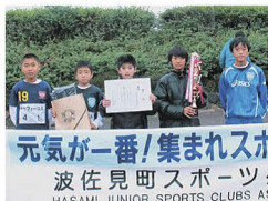
元気が一番！集まれスポ 波佐見町スポーツ CLUBS A

優勝 テサフイー「波佐見」FC A 準優勝 鴻ノ巣少年野球クラブ B 第3位 テサフイー「波佐見」FC A