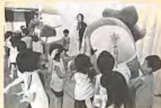
◀園児たちにも大人気

同日開催されていた「高齢者いきいき大学」とアナンダ幼稚園でPR活動を行い、参加者は記念撮影を行うなど、大変喜ばれていました。