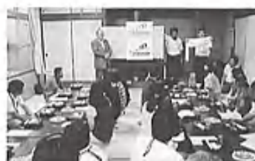
▲波佐見地区懇談会