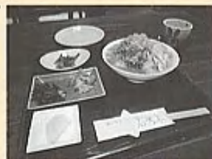
▲文化の陶四季舎の「冷汁セット」

ミョウガやキュウリを盛付け、味噌ベースの汁をかけた昔ながらのものから、海鮮を使った和風ダシベースのものまで、各店趣向を凝らした一品を用意。さっぱりした味付けでスルスルと食べられる冷汁は、夏バテ防止に一役買ってくれたことでしょう。