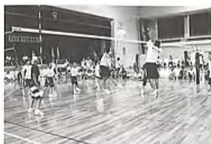
▲白熱した試合でした