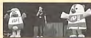
高齢者いきいき大学でのPR▶