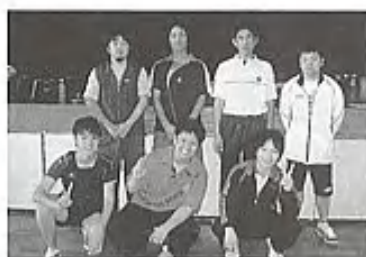
▲卓球協会の皆さん