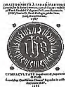
▲原マルチノの演説(1588年刊)「原マルチノ物語」より