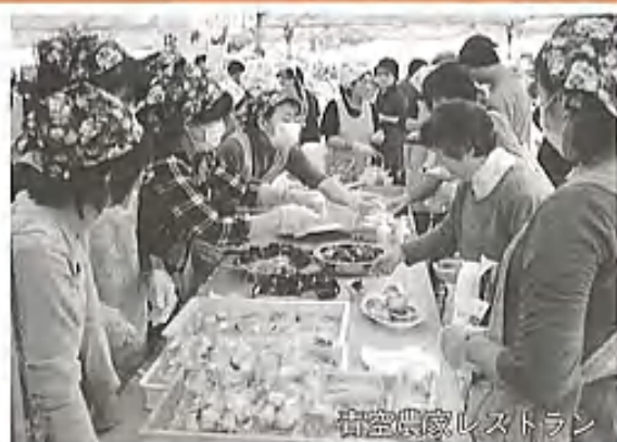
宿空農家レストラン