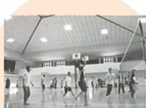
▲楽しみながらも、自然した試合でした