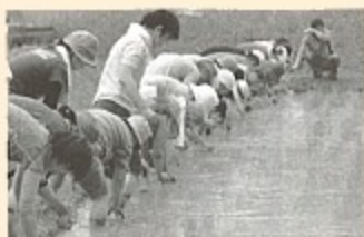
▲田植えをする参加者