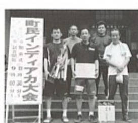
▲男子の部優勝サターン（志折）