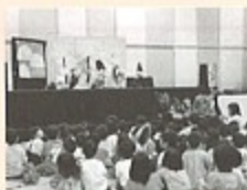
▲人形劇「いっすんぼうし」

5月26日、「絵本であそぼう！」が総合文化会館で開催されました。エプロンを使ってのお芝居や読み語り、紙芝居、人形劇などが行われました。参加した子どもたちは、特に人形劇では人形の動きに目を凝らしながら、夢中になって聞き入っていました。