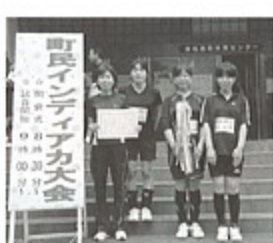
▲女子の部優勝折敷瀬A