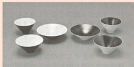
日刊工業新聞社賞 「Black or White?」 松尾 修介（村木）