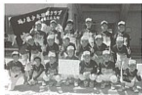
▲第3位に入賞した鴻ノ巣少年野球クラブ

5月3日～5日に大村市で開催された「高円宮杯全日本学童軟式野球大会・長崎県予選大会」において、鴻ノ巣少年野球クラブが第3位に入賞しました。これにより8月25日～26日に宮崎県宮崎市で行われる九州大会への出場権を獲得しました。九州大会でのさらなる活躍が期待されます。