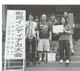
▲混合の部優勝協和2号