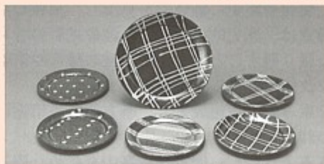
有田焼卸団地協同組合賞 「スリップウェアテーブルセット」 中川 紀夫（中尾）